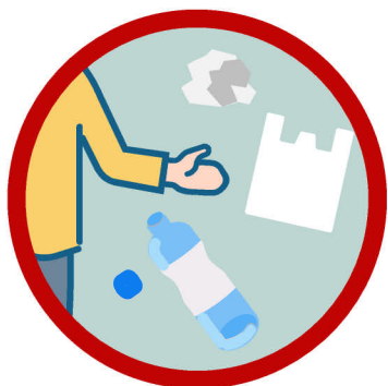
ポイ捨てされた ペットボトル