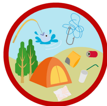
レジャーで出たごみ 釣り針のついた釣り糸 など