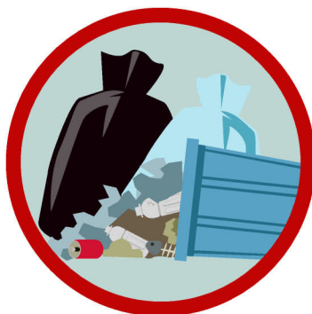
ゴミステーションから 散らばったごみ