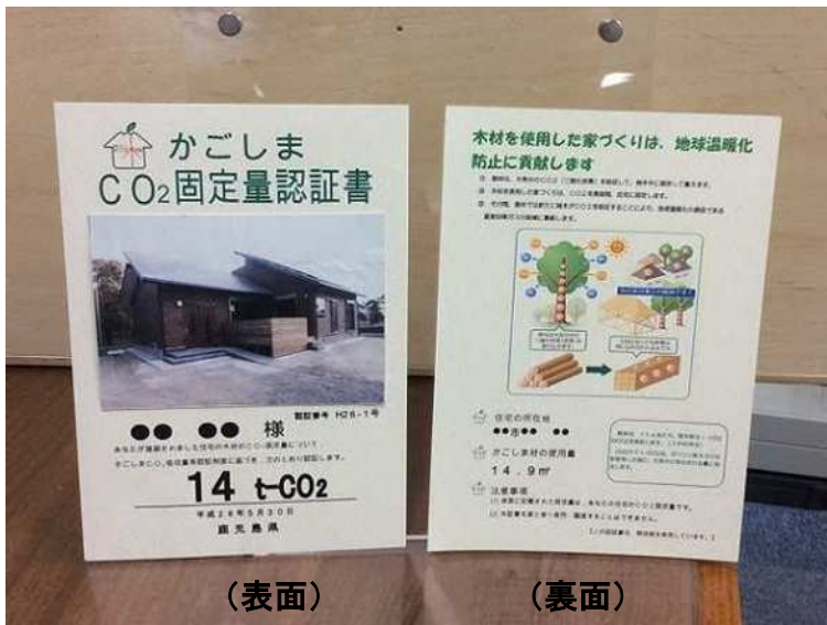
上の認証書を建築主様あてに作成し、お渡します

鹿児島県では、かごしま材を使用した家づくりによる環境貢献度を「見える化」し、地球温暖化防止に対する認識を深めてもらうとともに、かごしま材の利用促進を図るため、環境にやさしい「かごしま木の家」のCO2固定量の認証を行っています。