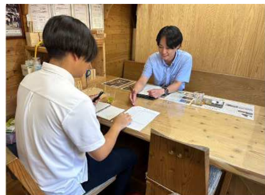
県産 J A S 製材品の販売促進活動 （かごしま材競争力強化対策事業）