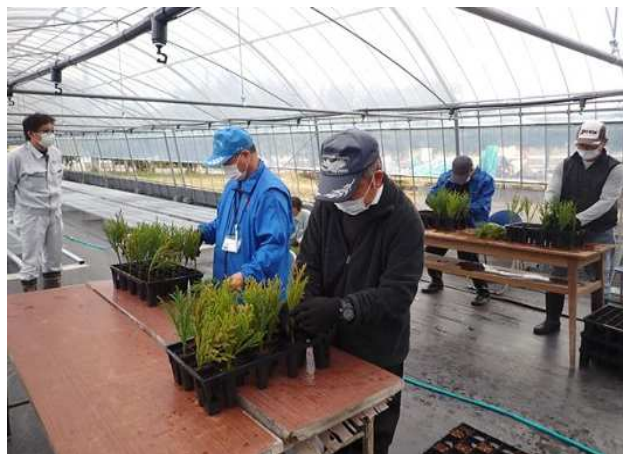
苗木生産技術向上講座 (種苗事業)