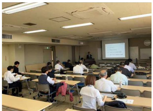
かごしま材利用セミナー (かごしま材需要創出促進事業)