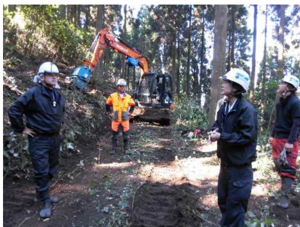
地域リーダー養成講座 (地域リーダー活動促進事業)