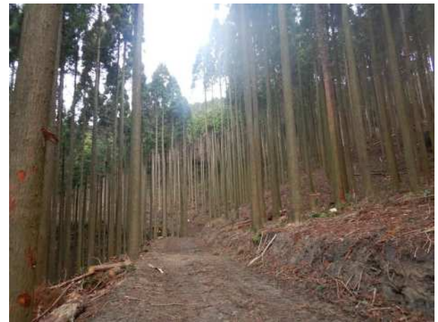
森林作業道の整備 (ふるさとの森生産性強化対策事業)