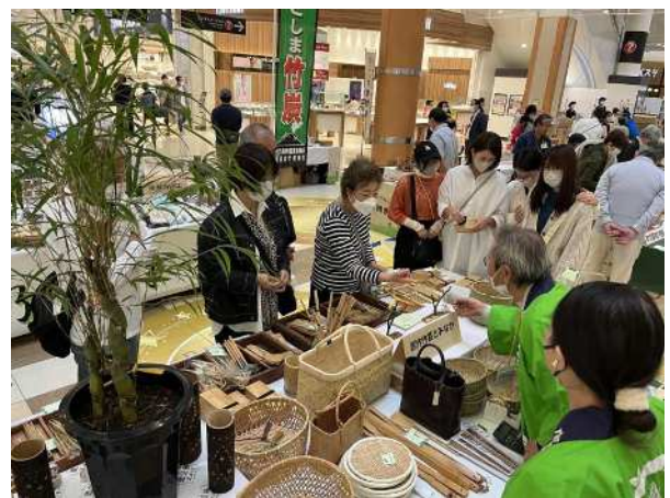
竹製品まつり (かごしまの竹で育む産地づくり事業)