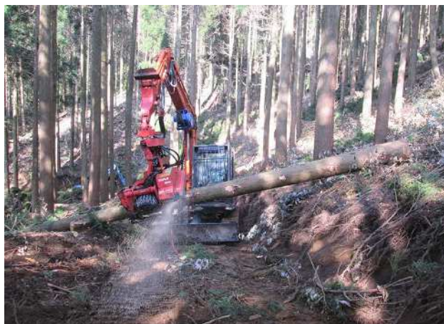
搬出間伐の状況 (ふるさとの森生産性強化対策事業)