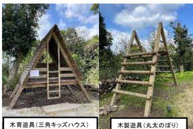
木育遊具(三角キッズハウス)