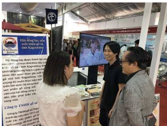
ベトナムの建築建材等展示会 （稼ぐ「かごしま材」輸出拡大事業）