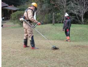
森林ボランティア技術研修 (刈払機の取扱)