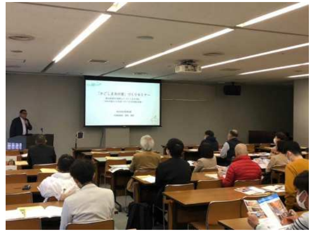
「かごしま木の家」づくりセミナーの開催 (木って活かす建てて生かす「かごしま木の家」推進事業)