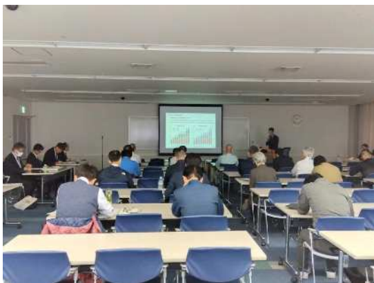
県産材輸出促進セミナーの開催 （稼ぐ「かごしま材」輸出拡大事業）