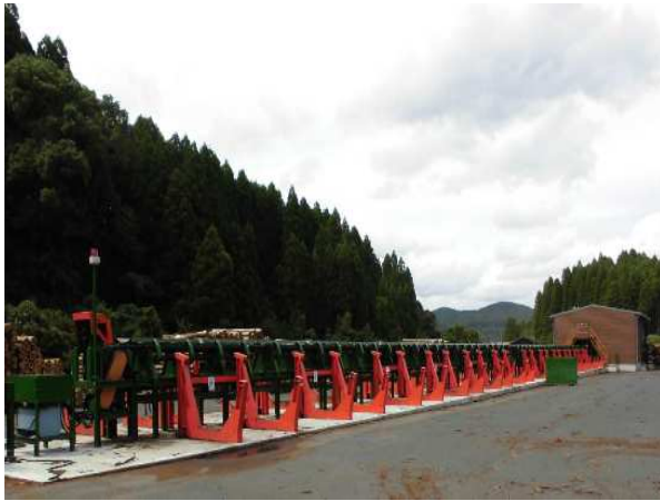
木材加工流通施設の整備 〈選別機〉 (力強い木材産業生産性強化対策事業)