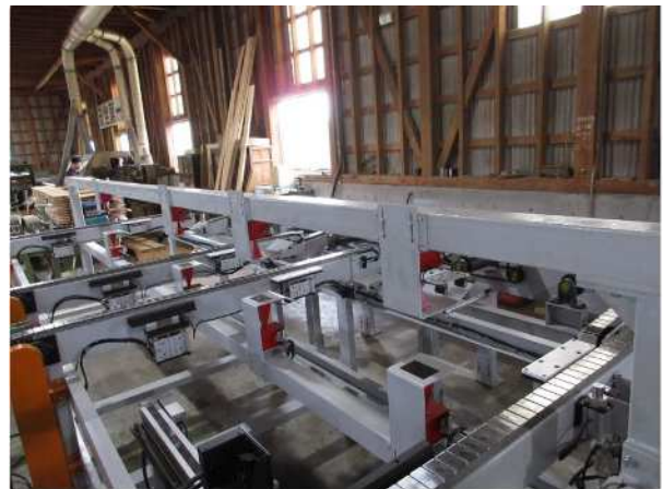
強度測定装置の整備 〈グレーディングマシン〉 (かごしま材競争力強化施設整備支援事業)