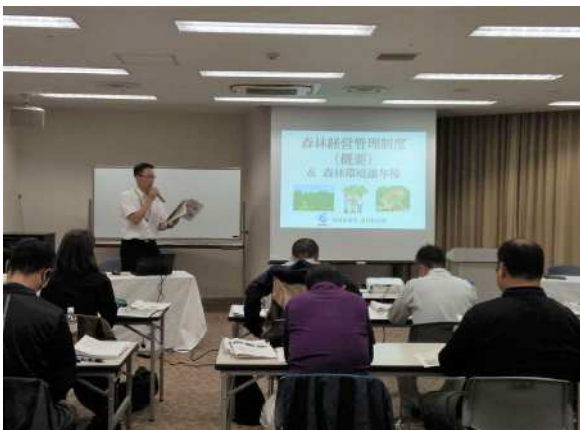
地域林政アドバイザーの育成研修 (地域林政アドバイザー育成・確保事業)