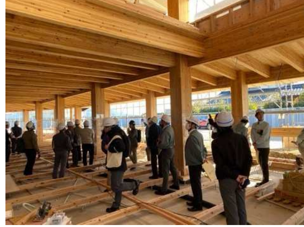
構造見学会の開催 (かごしま材需要創出促進事業)