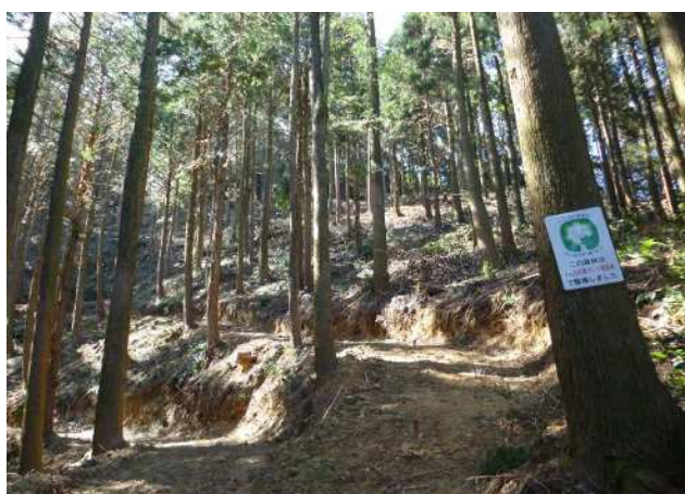
間伐施行箇所 (未来につなぐ森林(もり)づくり推進事業)