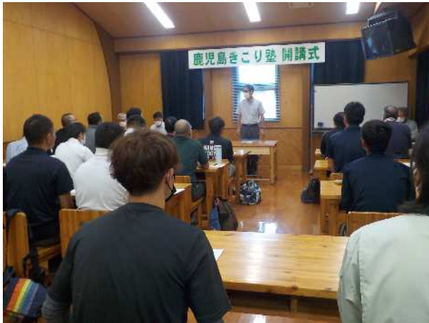
鹿児島きこり塾 (林業担い手確保・育成総合対策事業)