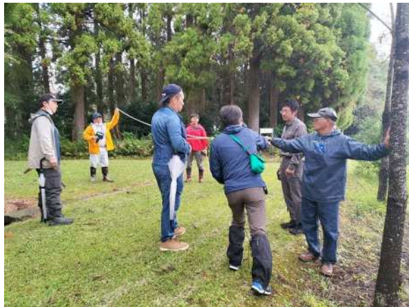
森林経営プランナー育成研修 (林業担い手確保・育成総合対策事業)