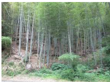
雑木竹林の伐採整理