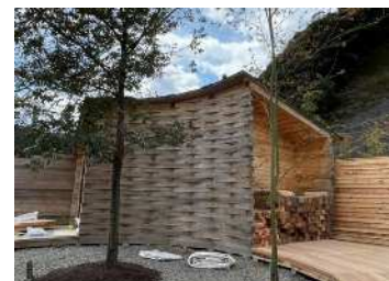
木製品の開発 (木製サウナ小屋)