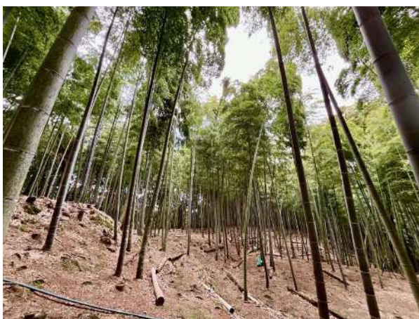
竹林改良 (かごしまの竹で育む産地づくり事業)