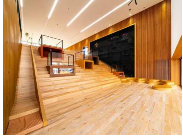
かごしま材利用建築物コンクールの受賞施設 (木とふれあう環境づくり推進事業)