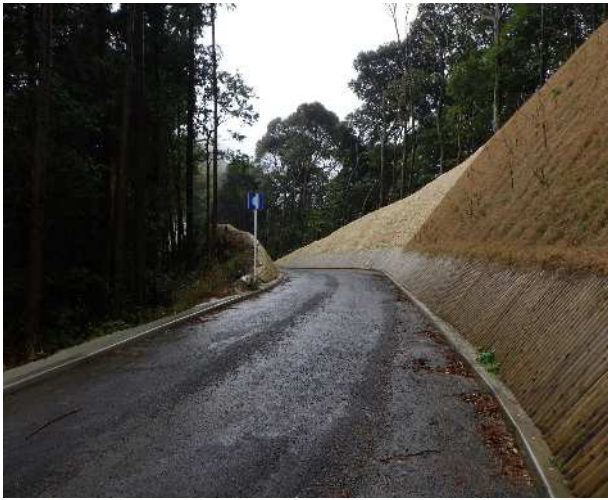
森林管理道の整備 (林道事業)