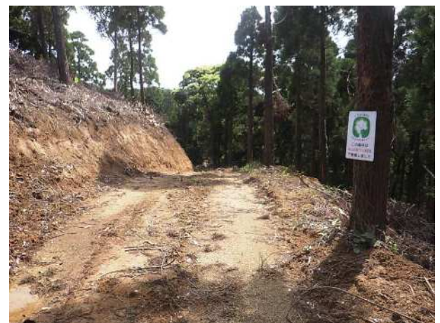
作業路の整備 (未来につなぐ森林(もり)づくり推進事業)