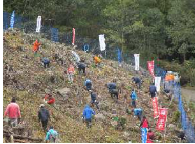
企業の森林(もり)づくり活動 (企業による植栽)