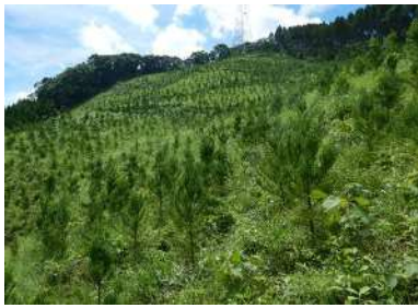
人工林伐採跡地の再造林