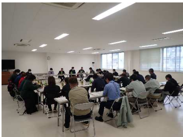
地域未来の森林（もり）づくり推進会議 (未来につなぐ森林(もり)づくり推進事業)