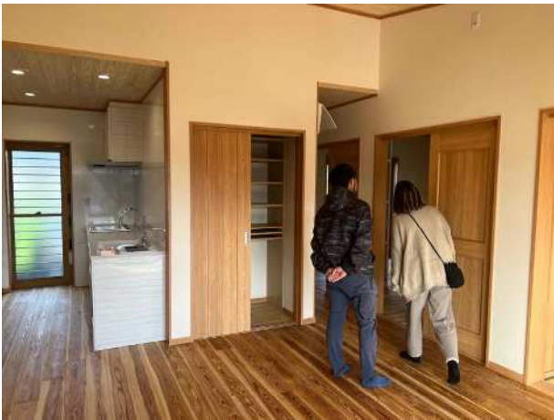
かごしま緑の工務店の完成見学会 (木って活かす建てて生かす「かごしま木の家」推進事業)