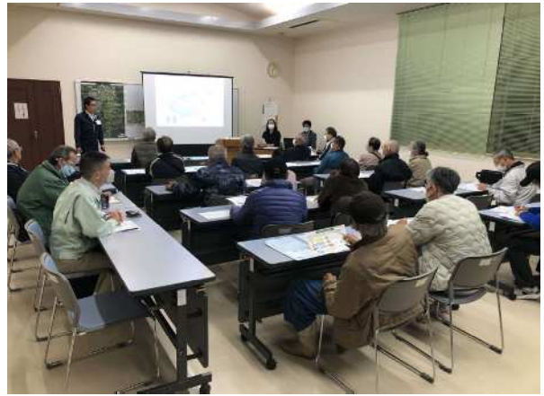
森林経営管理制度の住民説明会 (森林経営管理推進サポート事業)