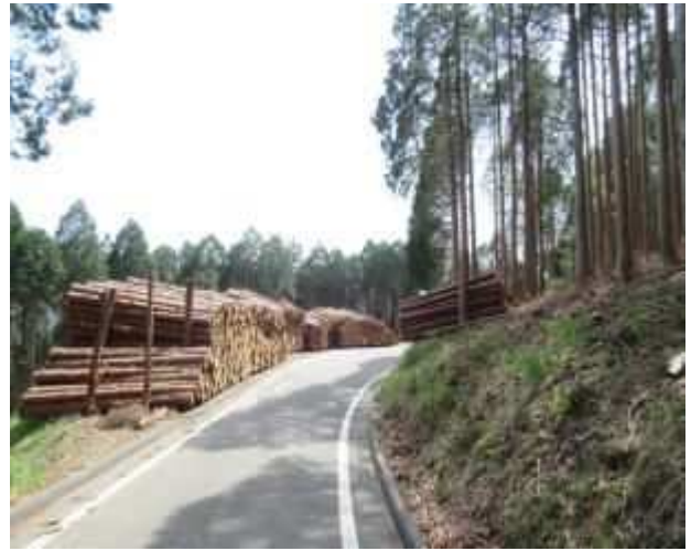
森林管理道の活用状況 (林道事業)