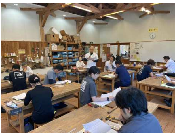
木育インストラクターの養成 (木とふれあう環境づくり推進事業)