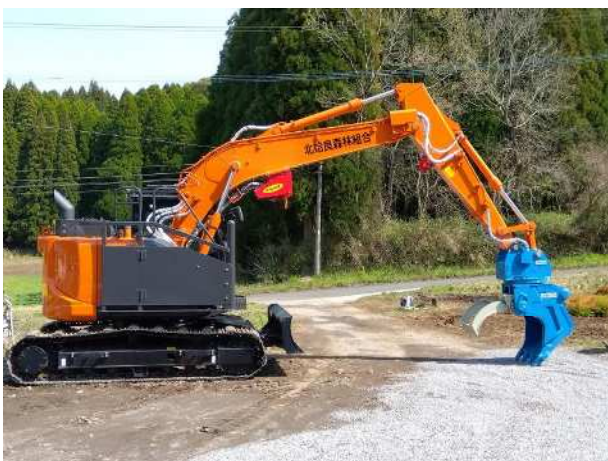
機械・器具の導入 (未来につなぐ森林(もり)づくり推進事業)