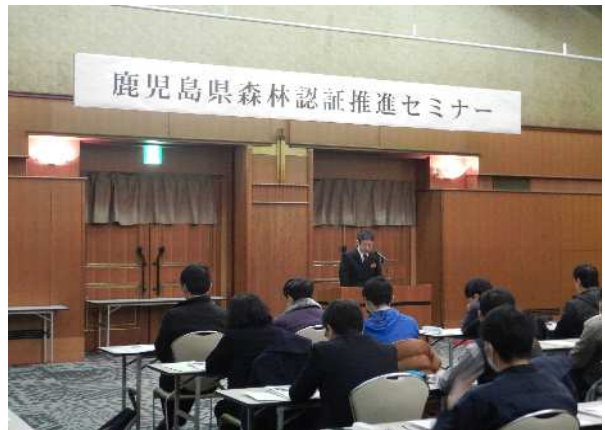
鹿児島県森林認証推進セミナー (持続可能な森林経営推進事業)