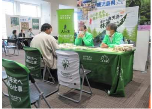
林業就業促進のための相談会 (林業担い手確保・育成総合対策事業)