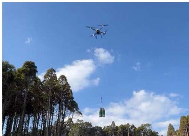
ドローンによる苗木運搬状況 (再造林等のスマート化支援事業)