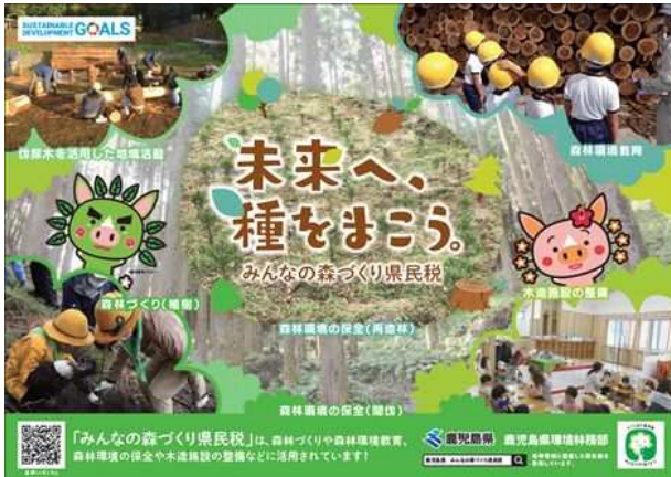
森林づくり活動の広報 (森林(もり)とのふれあい推進事業)