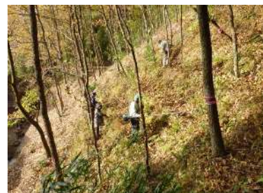
地域住民が共同して行う里山林整備