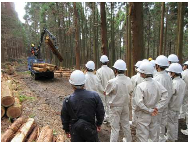
木材生産体験学習 (森林環境教育推進事業)