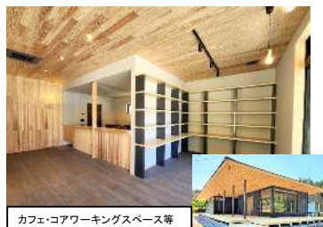
カフェ・コアワーキングスペース等