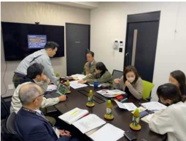
設計サポーターによる技術支援 (かごしま材需要創出促進事業)