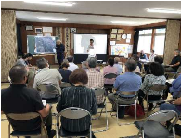
集約化対象森林の確認 (森林整備地域活動支援事業)