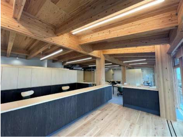
木造施設の整備 (木とふれあう環境づくり推進事業)