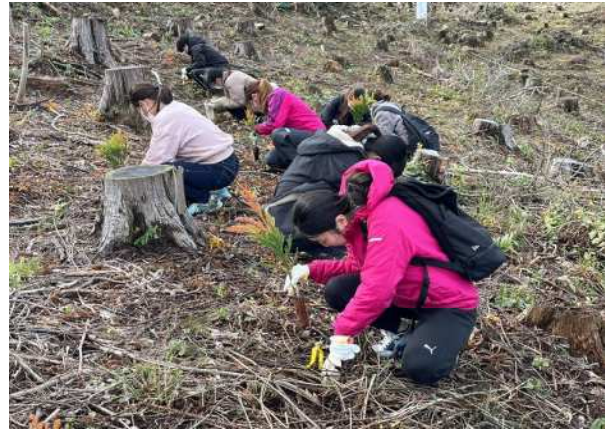
九州森林(もり)の日植樹祭 (森林(もり)とのふれあい推進事業)