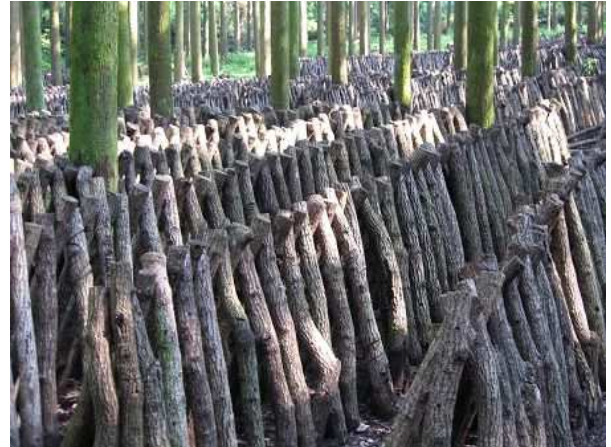
原木購入の助成 (特用林産物の恵み豊かな産地づくり事業)