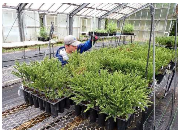
次世代スギコンテナ苗の成長量調査 (未来につなぐ森林(もり)づくり推進事業)