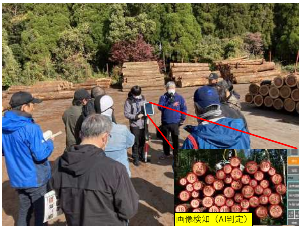
I C Tを活用した研修会の開催 〈木材検収ソフトの操作研修〉 (県産材流通コスト低減対策事業)