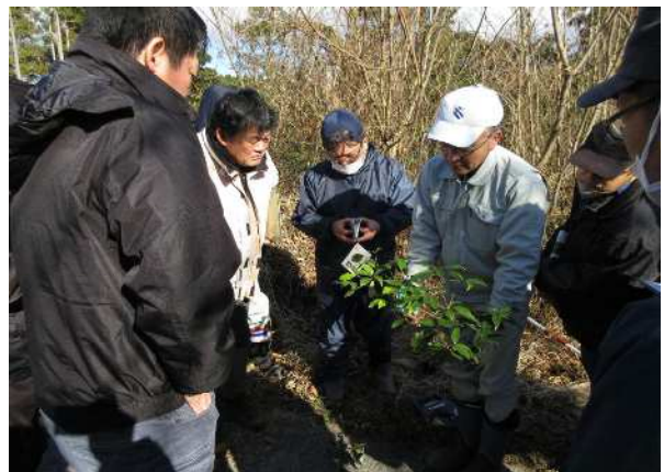
スキル向上研修 (市町村森林管理技術者等養成事業)