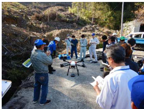
再造林技術研修会<ドローンによる苗木運搬> (未来につなぐ森林(もり)づくり推進事業)