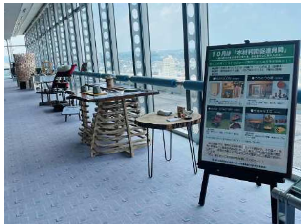
木製品の展示・PR (木とふれあう環境づくり推進事業)