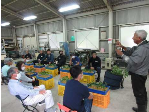
枝物生産者養成講座 (特用林産物の恵み豊かな産地づくり事業)