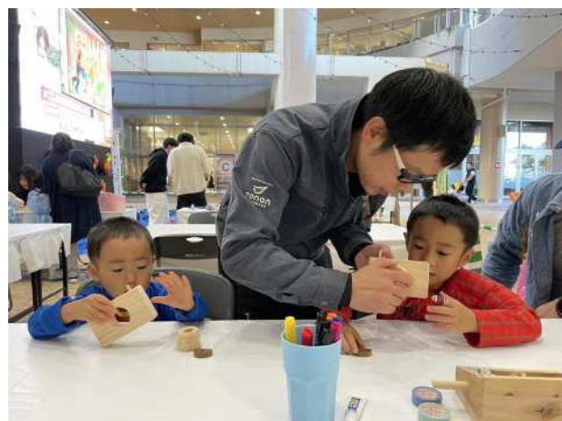
木育活動の実施 (木とふれあう環境づくり推進事業)