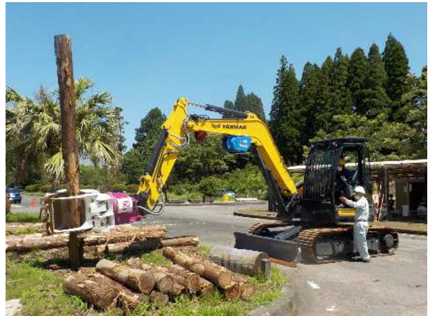
技能講習・安全教育等 (林業担い手確保・育成総合対策事業)