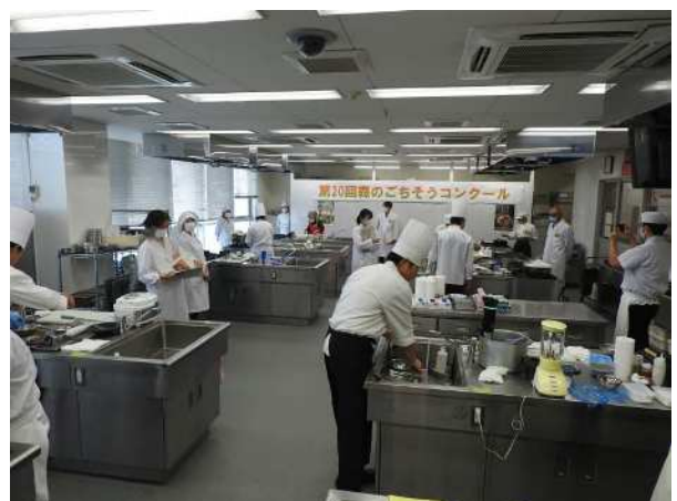
森のごちそうコンクール (特用林産物の恵み豊かな産地づくり事業)