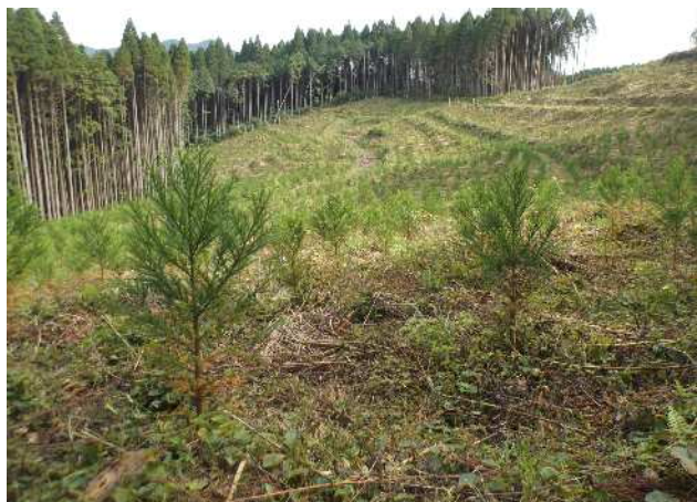
再造林施行箇所 (造林補助事業)