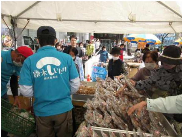
原木しいたけフェア (特用林産物の恵み豊かな産地づくり事業)