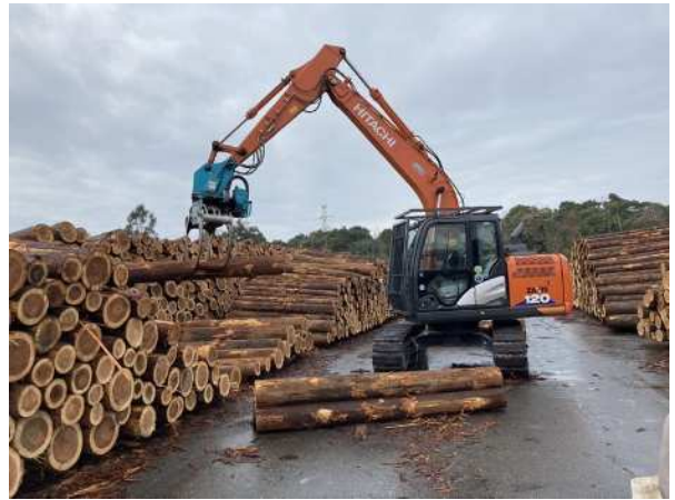
中間土場の活用支援 〈出荷先毎の仕分け状況〉 (県産材流通コスト低減対策事業)