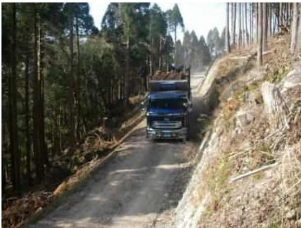
林業専用道の整備 (ふるさとの森生産性強化対策事業)