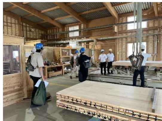
C L T 輸出の商談 （稼ぐ「かごしま材」輸出拡大事業）