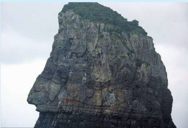
特別保護地区のナポレオン岩 (周辺は海域公園地区)