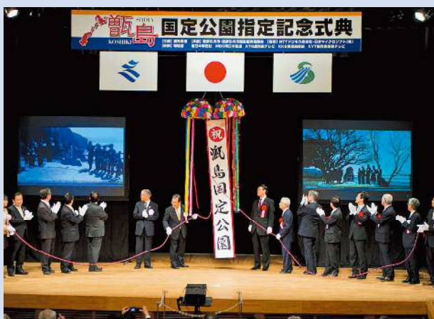
記念碑除幕・くす玉割り

また、甑島で記念碑の除幕式を行い、その模様を会場で中継し、現地と一体となったイベントとなりました。