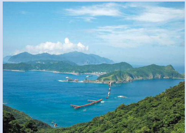
木の口山園地からの眺望

利用者が、甑島国定公園の特徴である海食崖や多様な海岸景観、豊かな自然環境を採勝できるよう、必要な利用施設を計画しています。