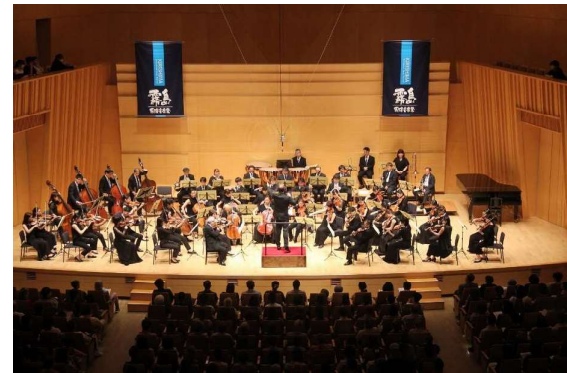
第44回霧島国際音楽祭