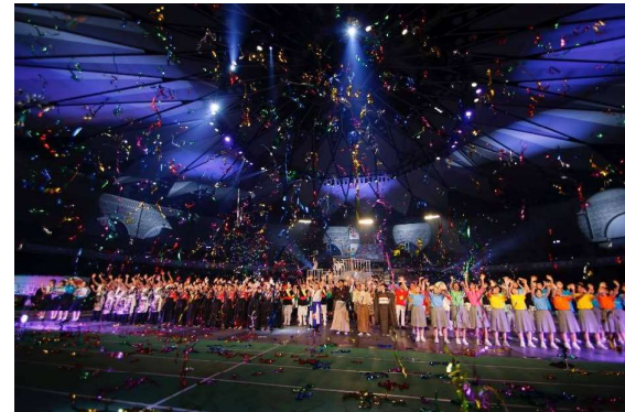
第47回全国高等学校総合文化祭