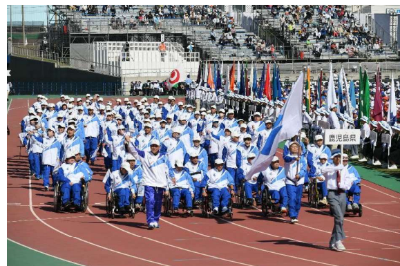
燃ゆる感動かごしま大会開会式