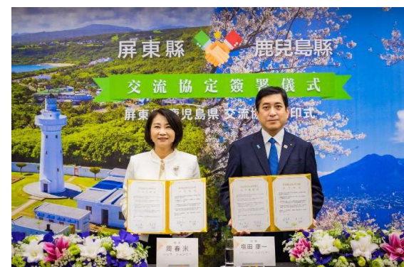
台湾屏東県とのMOU締結