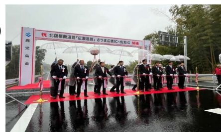
北薩横断道路「広瀬道路」開通