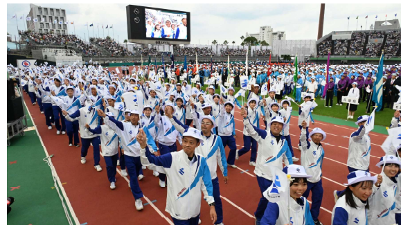
燃ゆる感動かごしま国体総合開会式