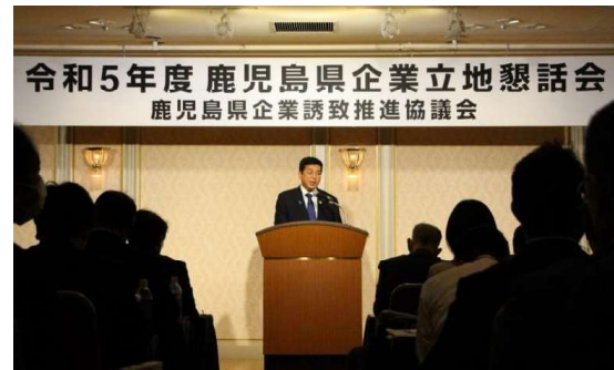
令和5年度鹿児島県企業立地懇話会