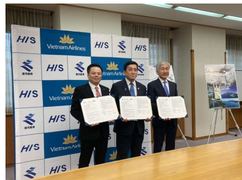
県、ベトナム航空、 (株)エイチ・アイ・エス による連携協定締結