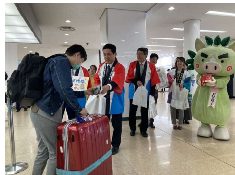
チャイナエアライン定期便再開