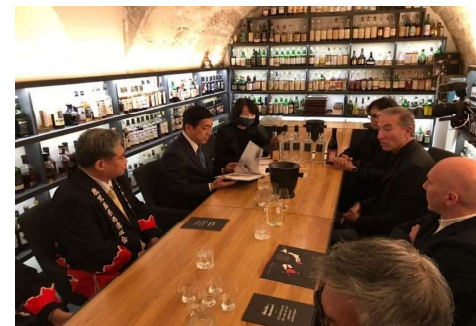
フランス大手酒類卸店において本格焼酎トップセールスを実施