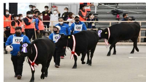
全国和牛能力共進会 鹿児島大会を開催