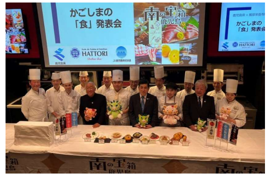
調理師専門学校において トップセールスを実施