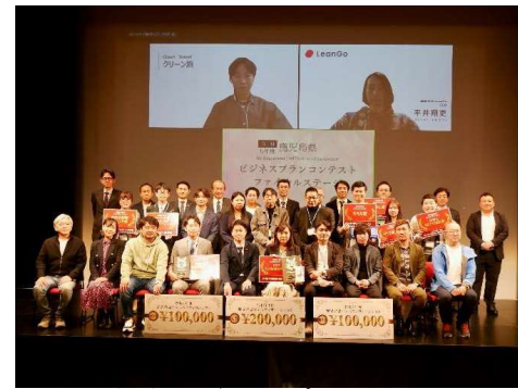
令和5年度ビジネスプランコンテスト