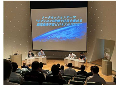
宇宙ビジネス創出推進研究会