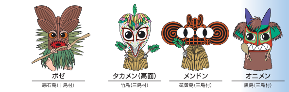
ボゼ 悪石島(十島村) タカメン(高面) 竹島(三島村) メンドン 硫黄島(三島村) オニメン 黒島(三島村)