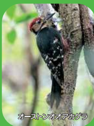
オーストリアオアカツツ

第二の人生をゆっくりと豊かに送るために、あるいは、マリンスポーツを十分に楽しむために、「かごしまの島々」に移り住む方々が増えてきています。