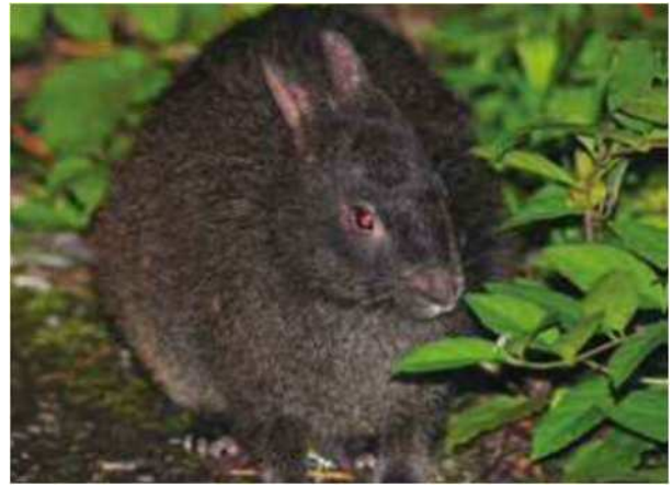
アマミノクロウサギ(特別天然記念物)

今後は、沖縄その他の奄美群島と近接する地域との多様な分野における連携に取り組みながら、それぞれの島がその特性に応じた振興開発を図ることにより、奄美群島の自立的発展を促進する必要がある。