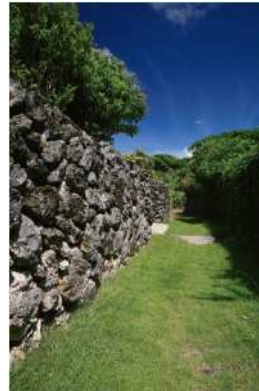
阿伝のサンゴ石垣