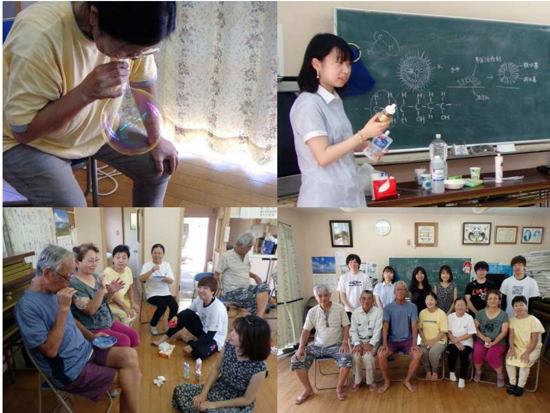
図 17 (続き)「シャボン玉の壊れにくさを科学で説明する」体験実験会