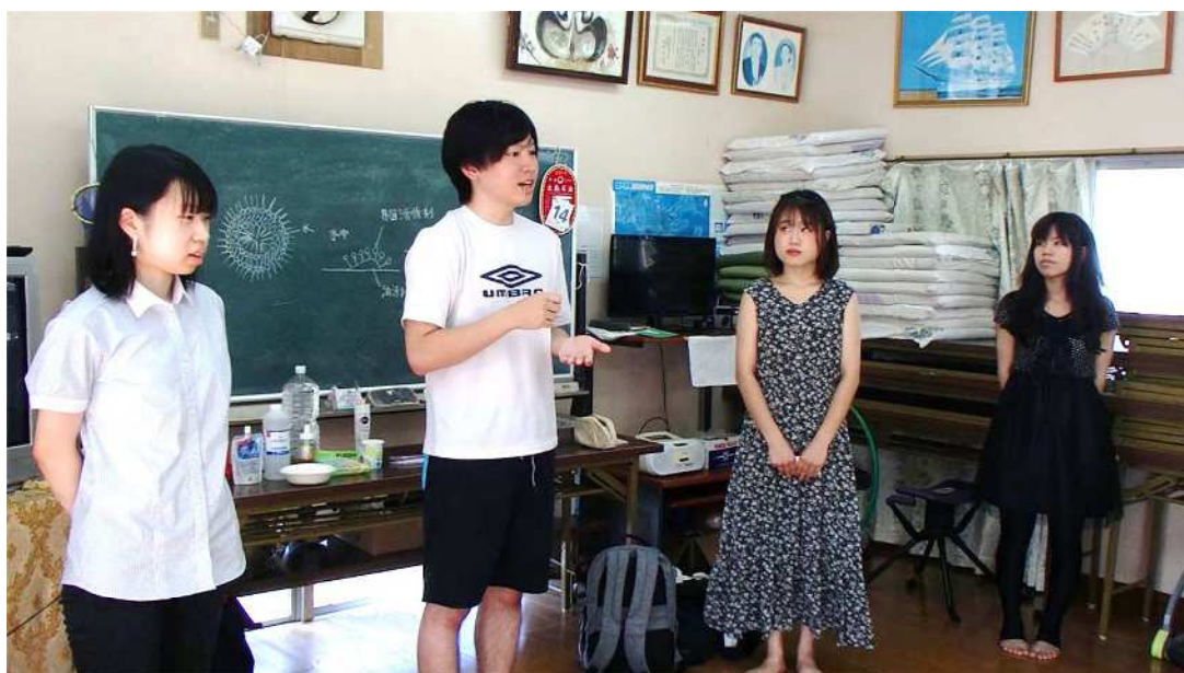
図 17 「シャボン玉の壊れにくさを科学で説明する」体験実験会 鹿児島県大島郡瀬戸内町加計呂麻島三浦集落公民館にて 2019 年 9 月 29 日に実施した。集落の高齢者 7 人を対象に、身近な食品や洗剤またはせんたく糊などを組み合わせると、実際に経験したこともないほど大きなシャボン玉を作ることができ、そのシャボン玉の丈夫さが分子間相互作用によって説明できることを体感した。

このような活動は参加者の啓蒙ばかりでなく、研究室の学生が科学研究の意義を一般市民に分かりやすく説明する技術を身につける貴重な機会となった。