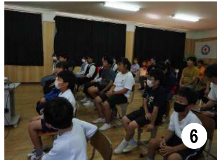
図の説明 1, 鹿児島港にて；2, 黒島大里港にて；3, 4, 片泊学園での授業風景；5, 6, 大里学園での授業風景.