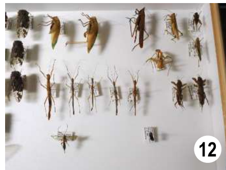
図の説明 鹿児島県博黒島昆虫標本. 7, ガ類; 8, チョウ類; 9, コウチュウ類 (カミキリムシ類); 10, コウチュウ類 (コガネムシ類); 11, セミ類; 12, 直翅系類.