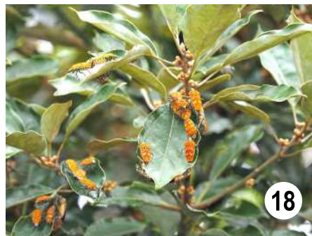
図の説明 13, 黒島遠景 (2018年3月12日小島弘昭撮影) ; 14, ウスバキトンボ ; 15, 16, カマドウマの1種 ; 17, アブラゼミ (2016年9月14日小島弘昭撮影) ; 18, アカギカメムシ (2017年5月10日小島弘昭撮影) .