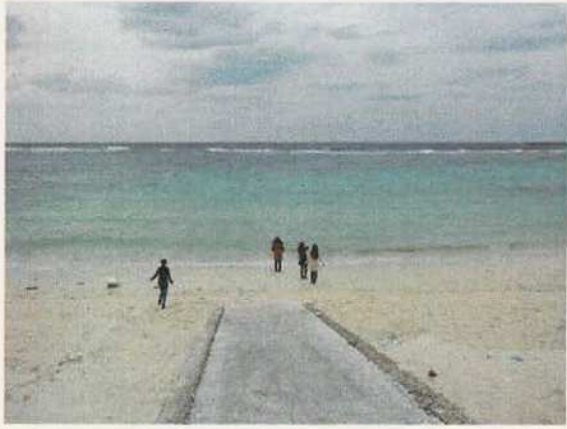
写真7 ワンジョビーチ