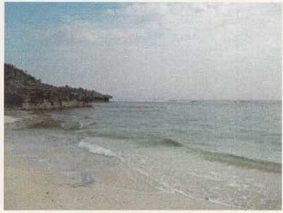
写真8 ワンジョビーチ