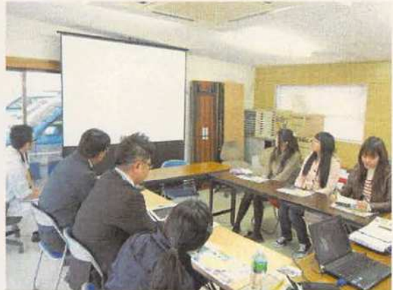
写真16 知名町役場での報告会