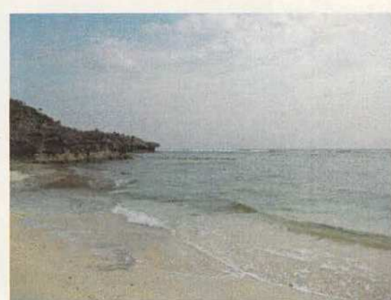
写真4 笠石海浜公園