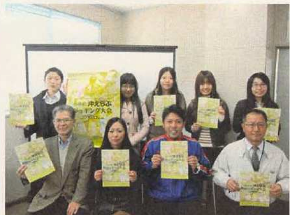
写真18 和泊町役場での報告会