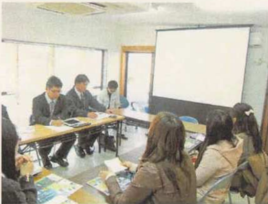
写真15 知名町役場での報告会