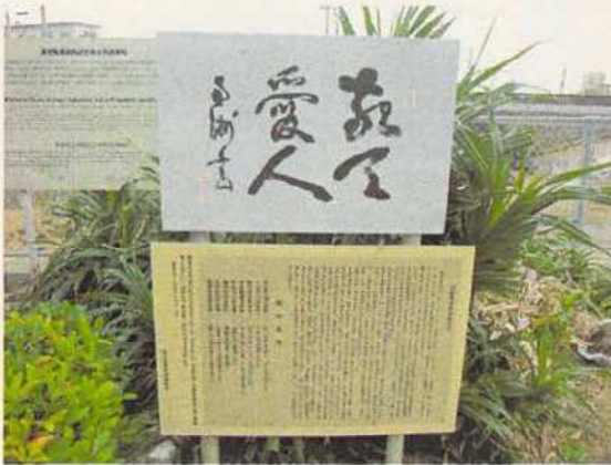
写真9 西郷隆盛謫居後