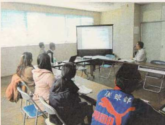
写真17 和泊町役場での報告会