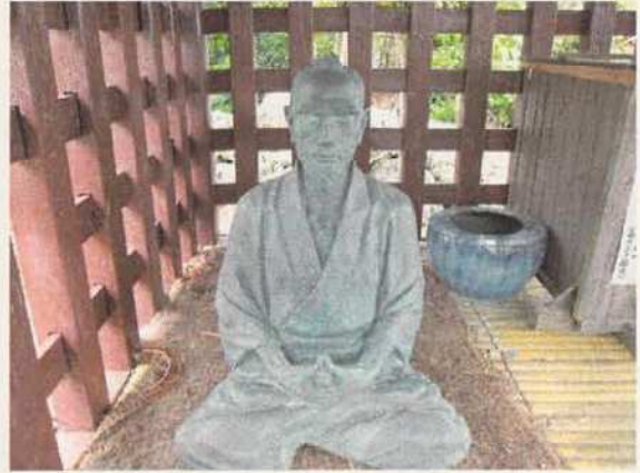
写真10 西郷隆盛謫居後