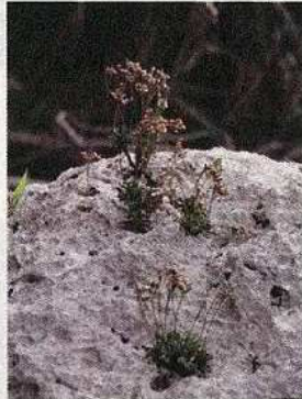
希少植物イソマツ