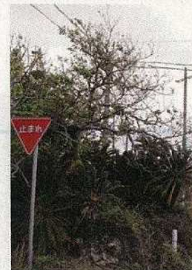
塩害にも強い島グワ (葉を出し、沢山の実をつけている)