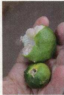
ガラガラミカン シークワサー