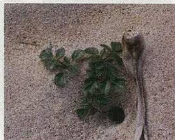
ハマボウフウ (食用/薬用)