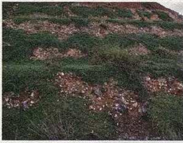
サトウキビ畑の地披 ヒメイワダレソウ