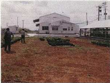
永良部特産品加工場／クワ、ユリを育種