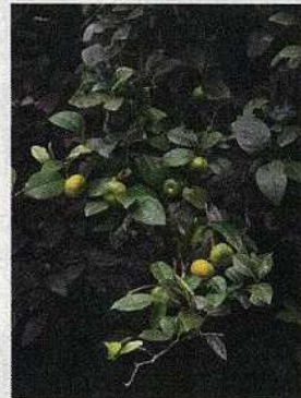
シークワサー (野生)