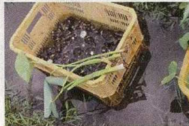
収穫したタイモと苗