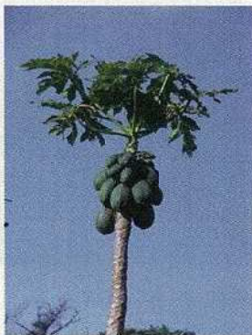
葉に機能性がある パパイヤ