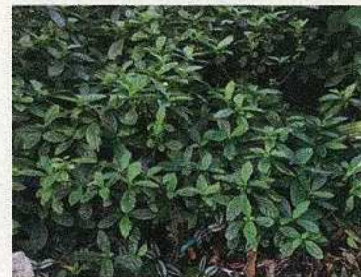
染色に用いるリュウキュウアイ