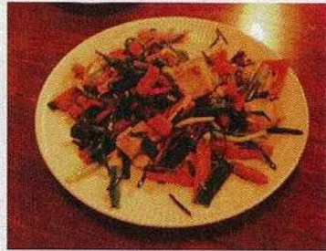
ニンニクの芽のチャンプル