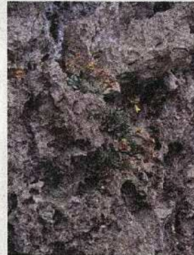
希少植物ウコンイソマツ