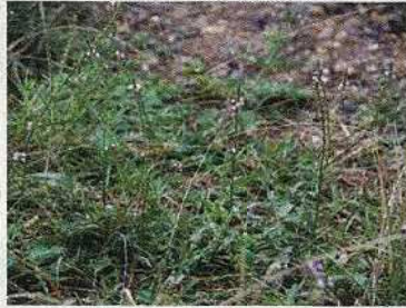
クマツヅラ (希少に)