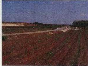
土地改良後のサトウキビ畑