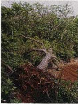
風害倒木のセンダン