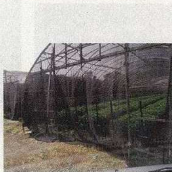
テップウユリの栽培 (連絡障害に注意が必要)