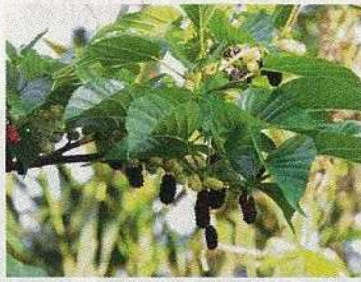
最高に美味しかった島クワ果実 和泊越山