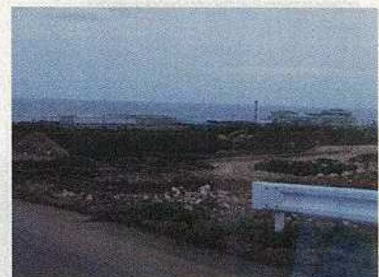
南栄糖業全景／和泊町皆川