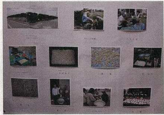
ソテツ (やらぶ) 味噌の作り方