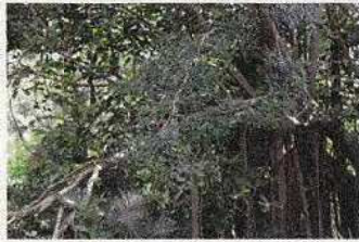
サルカケミカン大木/大山