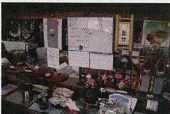
ヤギ汁等のメニュー (町外れの食堂のメニュー)