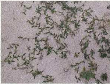
地披候補のクロイワザサ