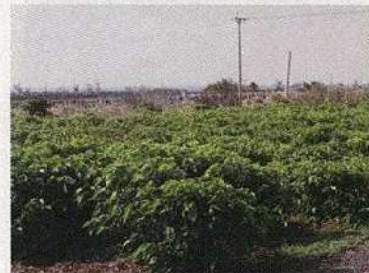
ヤマグワ畑／和泊町喜美留