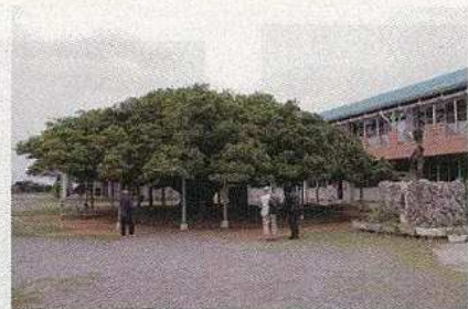
国頭小学校の 日本一のガジュマル