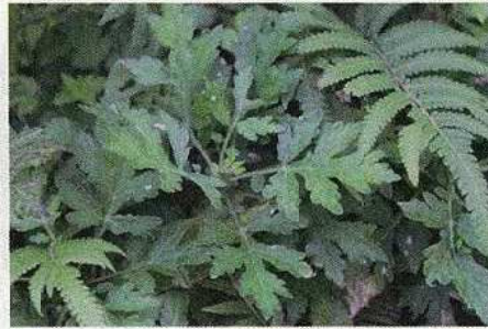
ようやく見つけたヨモギ (除草剤で希少植物に)