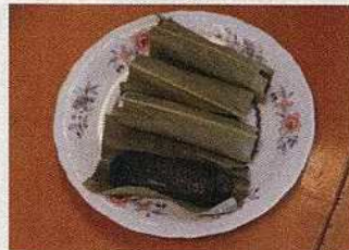
ヨモギ餅のゲットウ葉巻