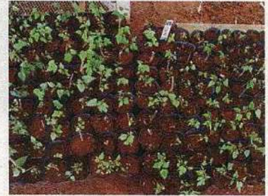
永良部特産品加工場／クワ