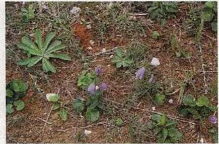
サイヨウシャジン