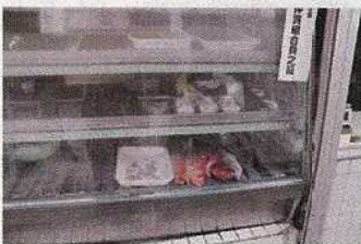
魚屋に鮮魚がほとんどいない (午前9時前)