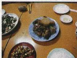
昔の豚の大根等の煮物