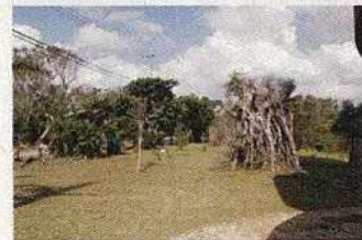
島外の樹木も 植えられている公園