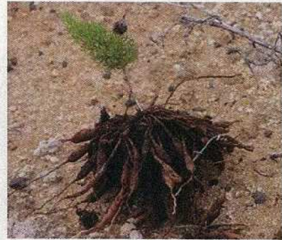
クサスギカズラ (地上部アスパラ様に、根：生薬)