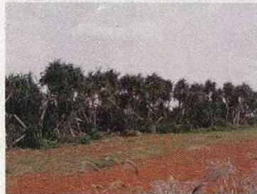
知名町新城アダン防風林