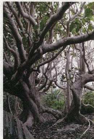
ハスノハギリの大木 2本がくっつき面白い (愛のハスノハギリ)