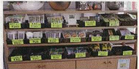
沖永良部の特産品コーナー