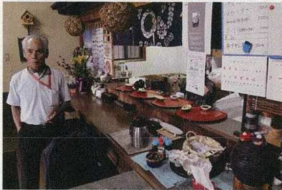
11/14 食堂での聞き取り