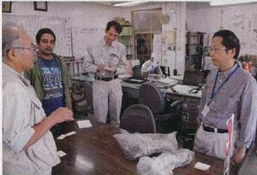
11/15 鹿児島県沖永良部事務所農業普及課調査