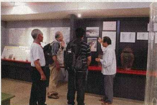
11/14 和泊民俗博物館聞き取り調査