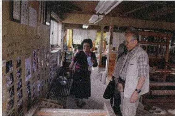
11/17、18 沖永良部芭蕉布工房での聞き取り調査