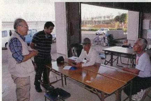
11/14 和泊実験農場聞き取り調査