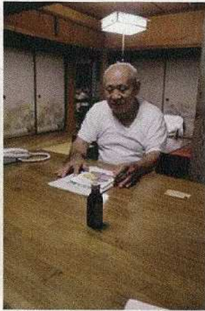
11/16 元町長宅での聞き取り