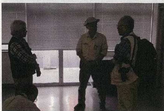
11/16 和泊図書館にて聞き取り調査