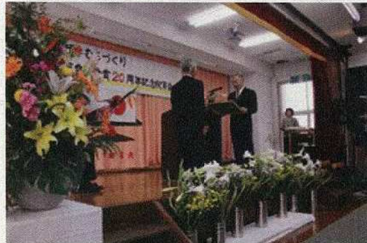
国頭宇天皇杯受賞20周年記念行事出席