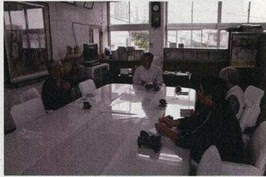
11/14 和泊町長表敬訪問、聞き取り調査