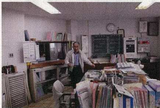
11/14 和泊研修センター聞き取り調査