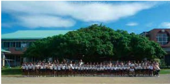
①日本一のカジマルと共生する地域(和泊町)