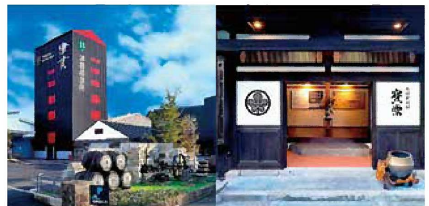
④本坊酒造(株)津貫蒸留所・寶常(南さつま市)