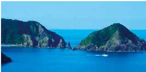
③坊津八景の伝承活動(南さつま市)