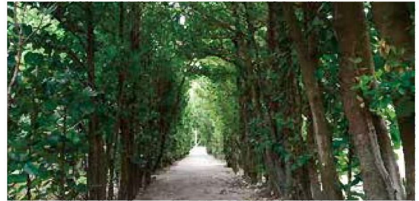
②フクギ並木などの景観を生かした地域づくり(大和村)