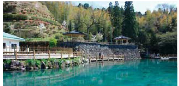
④丸池湧水の保全活動(湧水町)