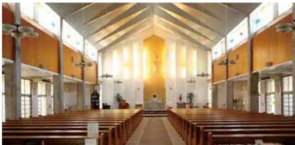
①カトリック名瀬聖心教会(奄美市)