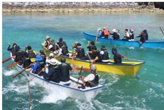
▲ハーレー大会 (SUP体験)