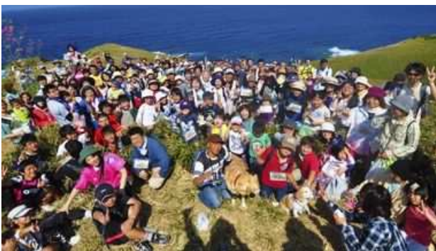
▲宮崎つつじウォーキング