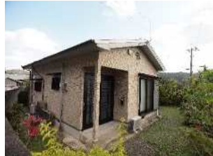
▲新しくオープンした民泊「GAMA屋(がまや)」