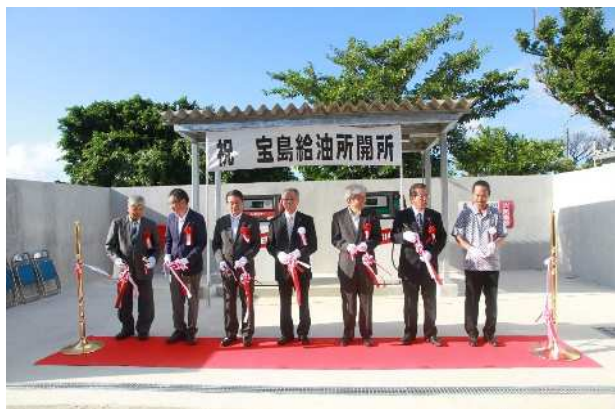
▲宝島給油所開所式(テープカット)の様子