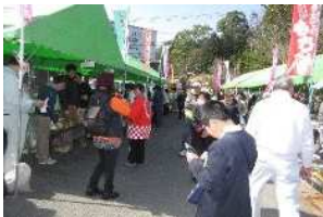
▲ おきな草春祭り露店