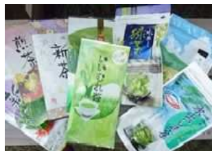
▲飯牟礼の特産品の「いいむれ茶」