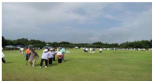
▲グラウンドゴルフ場