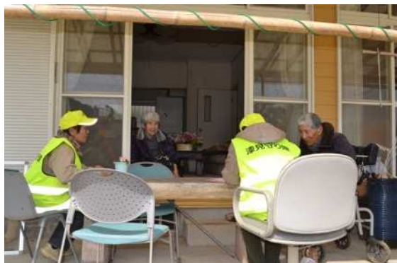
▼見守り隊の活動状況