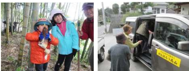
▲山菜狩りツアー等により高山地区ファンを生み出している。