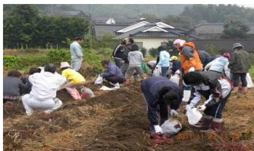
▲市街地の子も達への農業体験