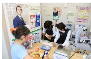
▲「悪石島簡易郵便局」