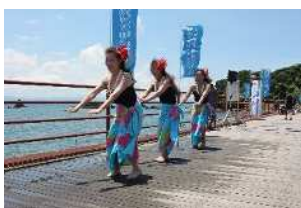
▲かのやマリンフェスタ