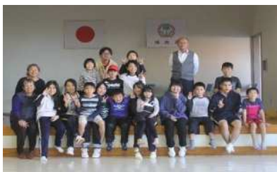
▲高校生・大学生等との集合写真