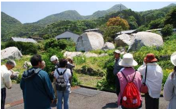
▲語り部(ガイド)による集落案内