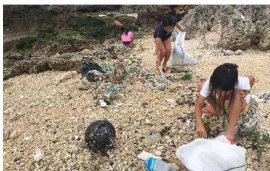
▲うじじきれい団ビーチクリーン活動の様子