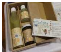
▲シロップ、味噌(140g)果汁の3点セット