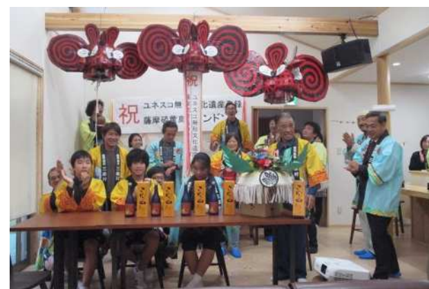
▲ ユネスコ登録決定を喜ぶ地区の保存会