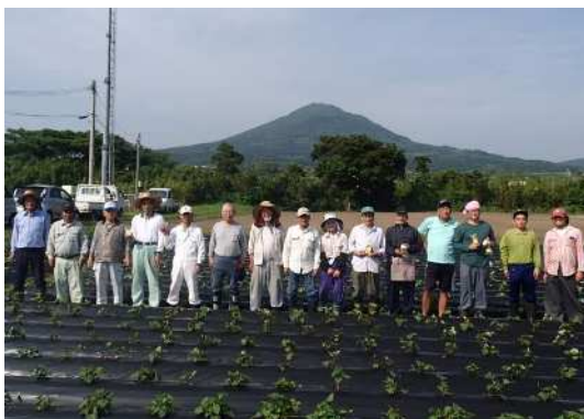
▲顛娃おこそ会メンバー