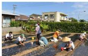
▲在来ニンニクの作付け