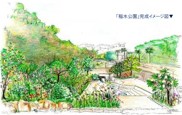
「稲水公園」完成イメージ図▼