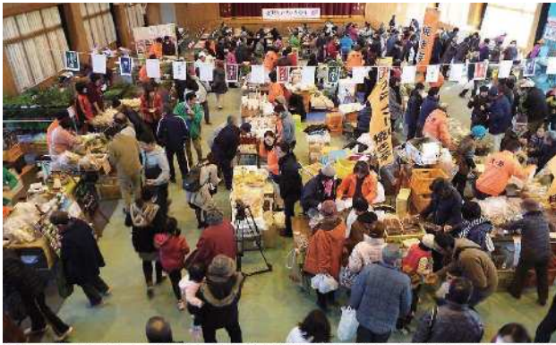
▲「大野原いきいき祭り」会場風景