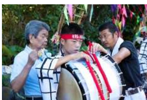
▲ 後継者と裏方を務める先輩ら