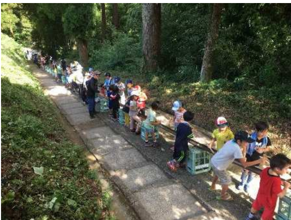
▲ やる気坂流しそめん(体験活動)