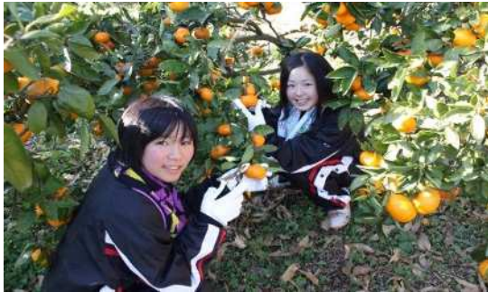
▲体験型教育旅行での農作業体験