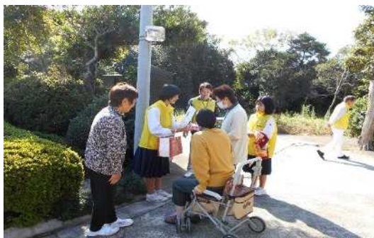
▲別府中3年生と地域合同の声かけ訓練