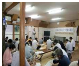
▲集落ぐるみでの話し合い活動