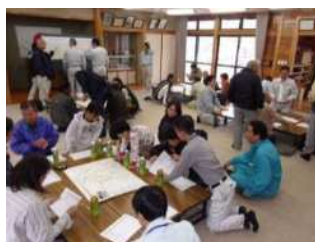
▲ 集落点検ワークショップの様子