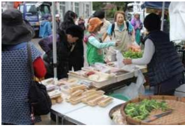
▲婦人会等による特産品販売の様子