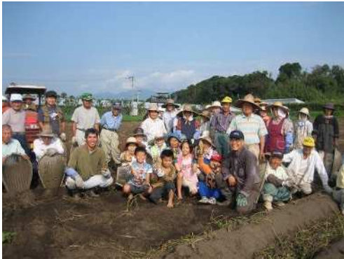
▲地域でサツマイモ収穫