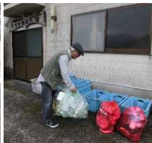
▲ごみステーションへ