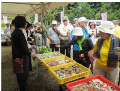
▲地元特産品の振る舞い