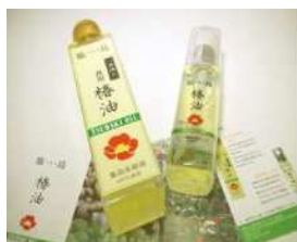
▲製品化された椿油