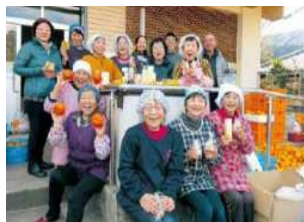
▲製品化には高齢者も参加