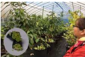
▲フィンガーライム栽培