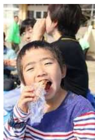
そばやがねに舌鼓