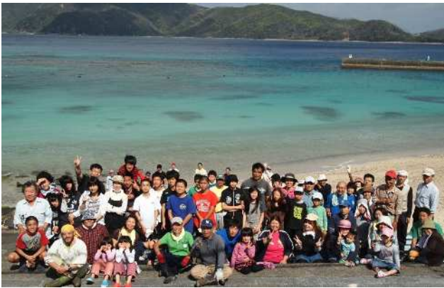
▲地域一丸となって取り組む崎原地区の皆さん