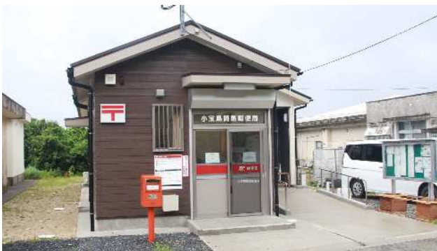
▲「小宝島簡易郵便局」外観