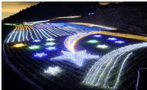
▲農閑期に行われる「八重のきらめき」