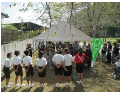
▲中学生による名所の説明