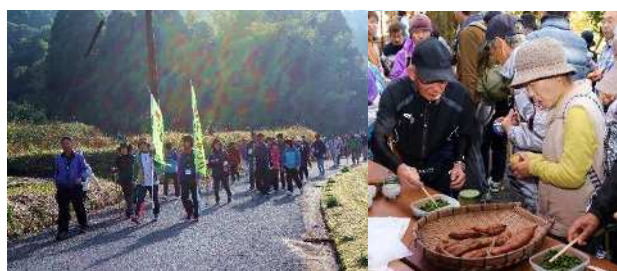
▲新米ウォーキング