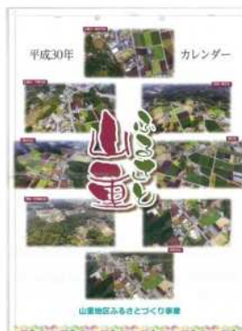
▲ふるさとカレンダー