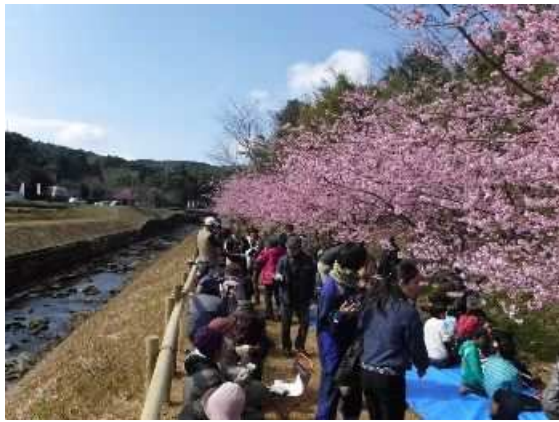
▲河津桜祭りの様子