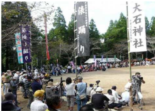
▲ 金吾様踊りの様子