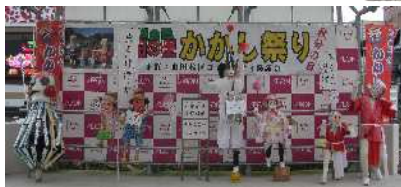
▲イオンタウン始良での展示