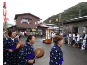
▲集落の伝統行事「八月踊り」の様子