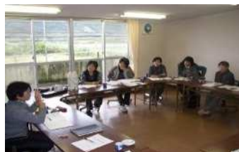
▲加工品開発についての協議