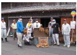
▲空き家再生の様子