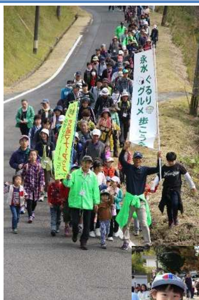
▲大人から子供まで参加