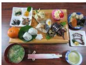
▲食事の提供(オプション)