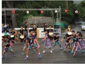
▲夏祭りでのジャンベ演奏