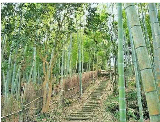
▲これまでの竹やぶが美しい竹林へ生まれ変わり、散策しやすくなる竹林の道へ