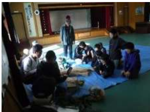
▲高齢者よりしめ縄づくりを伝授