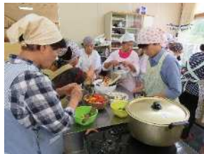
▲ 幸齢者大学(料理教室)