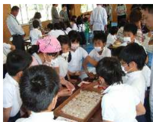
▲ いちご大福づくり食農教育の様子