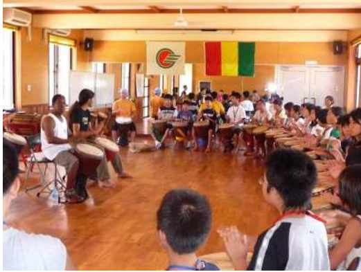
▲ジャンベの世界的奏者ママディ・ケイタ氏のワークショップを受講する島の子供たち