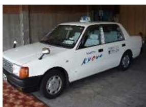
▲乗合タクシー車両