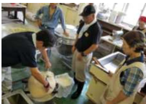
▲トウフづくり体験