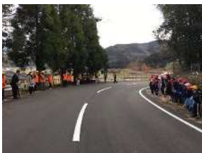
▲ あいさつ運動(見守り隊)