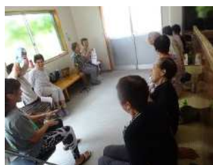
▲高齢者の健康体操