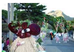
▲ 硫黄島八朔踊りとメンドン