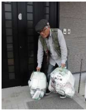
▲不在時は玄関先など