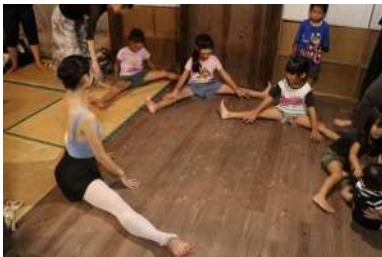
▲クラシックバレエイベントの開催