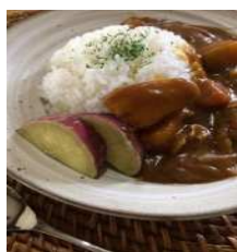
▲「かぞくいろ」にちなんだ「かぞくいも」カレー