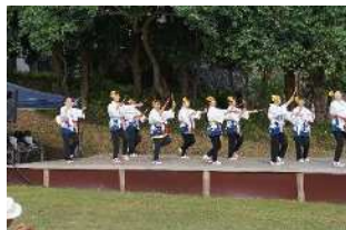
▲高齢者の活動発表