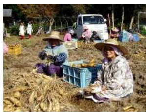
▲高齢者への交流の場の提供(簡単な農作業)