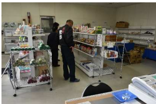
▲輝楽里たぶがわ 店内