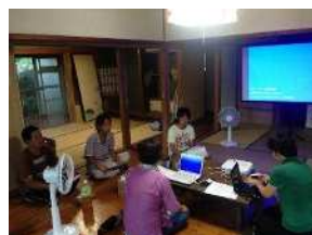
▲しまぐらしハウス立ち上げミーティングの様子