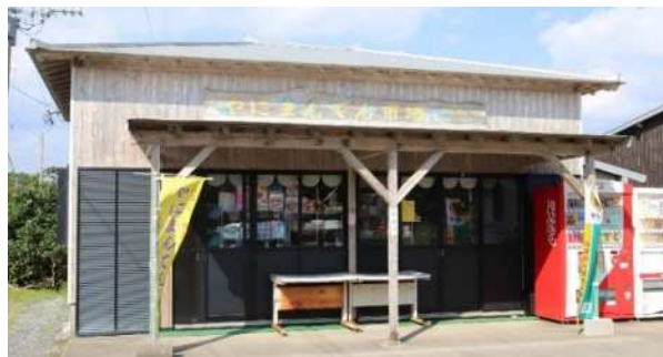
▲「やにまんてん市場」外観