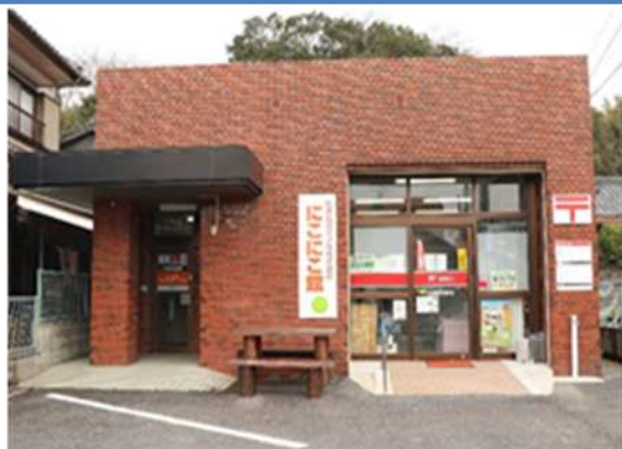
▲小さな拠点「ここに館」外観