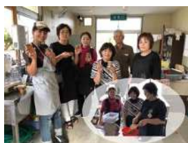
▲商品開発の試作中