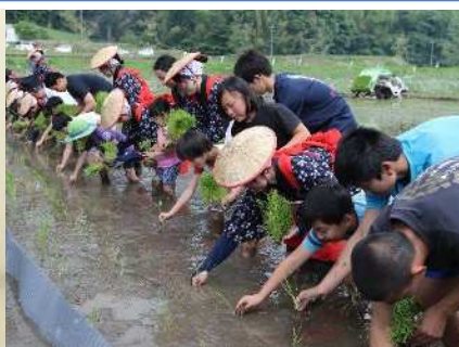
▲平成9年に復活したお田植え祭に早乙女姿の学生参加