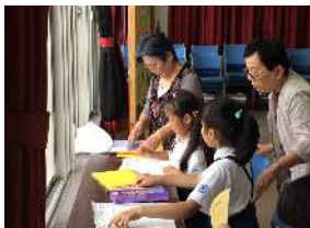
▲まず、宿題から・・・