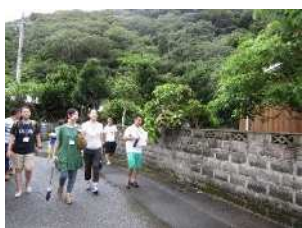
▲宿泊者を対象にした集落歩き体験