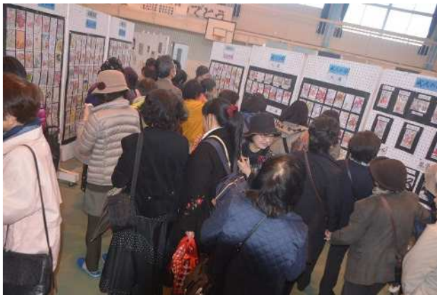
▲ 絵手紙コンテスト入選作品展示