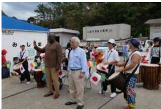
▲ジャンベで来島者を出迎える様子