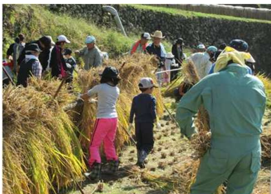
▲棚田の用水路では在来種のクロメダカが生息。メダカを育むきれいな水で育つ米作りをとおして、都市住民の農業への理解と次世代への継承の意識を生み出している。