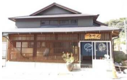
▲「より処 きてん」外観