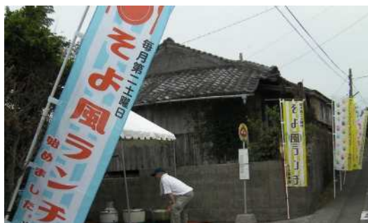
▲毎月1回住民手作りの「そよ風ランチ」を開催