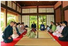
▲武家屋敷での着物着付体験