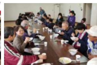
▲田舎料理体験(食事会)