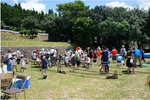
▲子育て支援の一貫としての「自然花夏まつり」