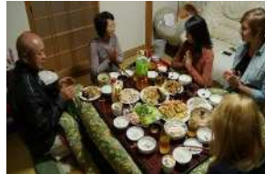
▲農家民泊による田舎料理体験