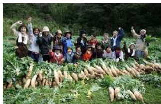
▲郷友会(あつたどこねくらぶ)