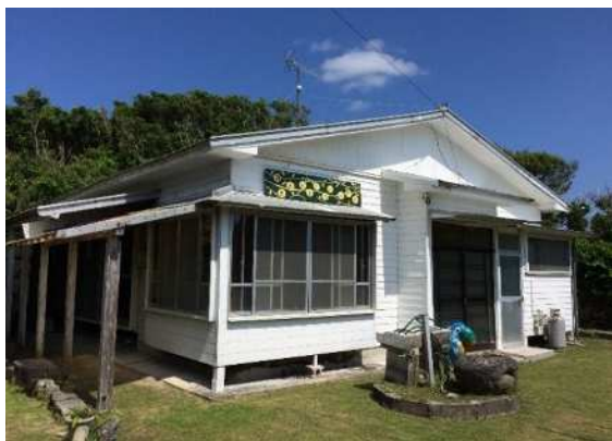
▲しまぐらしハウス外観