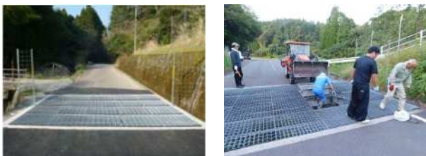
▲ 道路からの侵入を防ぐテキサスゲートの設置