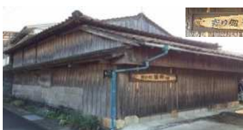
▲「寄り処 茶飲場」外観