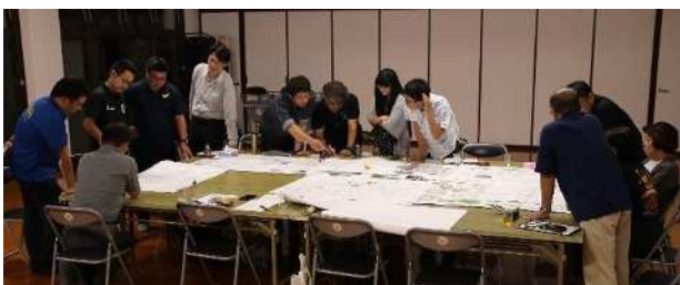
▲マチヘソミーティングの様子