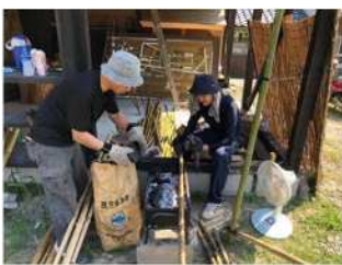
▲整備した竹林から竹の利活用