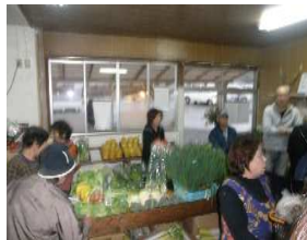
▲直売所で地元の食材を提供