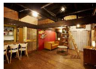
▲再生空き家を活用した宿