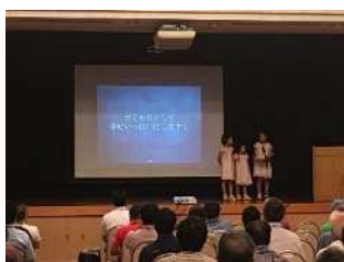
▲活動を発表する3姉妹