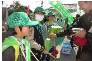
▲ 祭り会場の募金運動