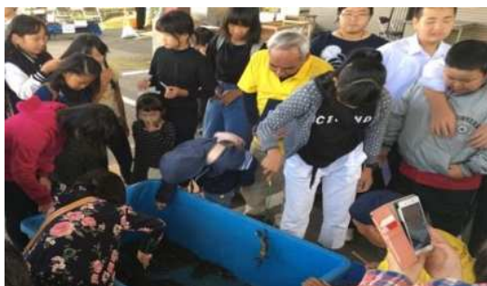
▲ふるさと収穫祭 山太郎蟹の釣り大会