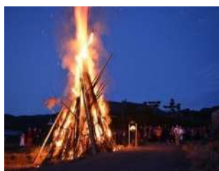
▲地区住民による鬼火焚き