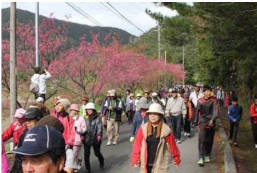
▲ウォーキング大会の様子