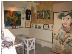
▲芸術家によるギャラリー