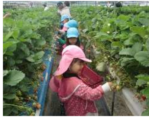
▲ チェスト館の体験農園