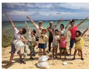
▲活動に共感した人々がビーチクリーンへ参加