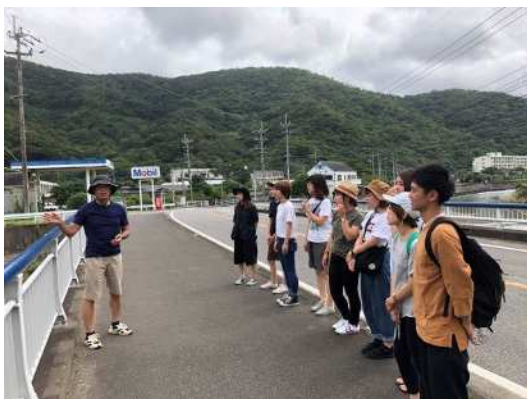
▲福山市立大学と地域資源の再発掘・整理と活用検討