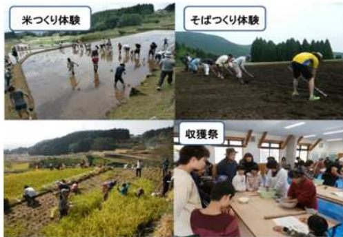
▲「農業体験 in 八重の棚田」一連のメニュー