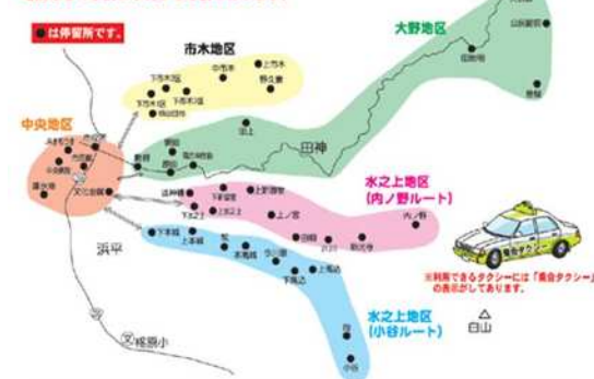
▲乗合タクシー運行ルート