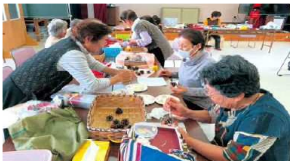
▲「なかよしサロン」での生きがいがづくり