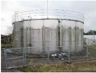
▲ 畑地かんがいの調整水槽(ファームホールド)