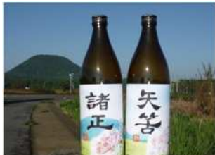
▲オリジナル焼酎「矢筍・諸正」