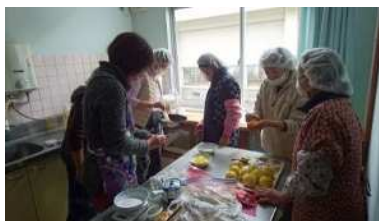
▲加工品試作の様子