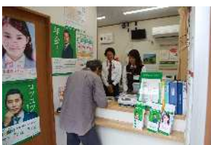
▲「諏訪之瀬島簡易郵便局」