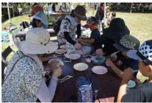
▲親子での体験活動