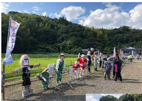
▲かかし祭り会場の様子