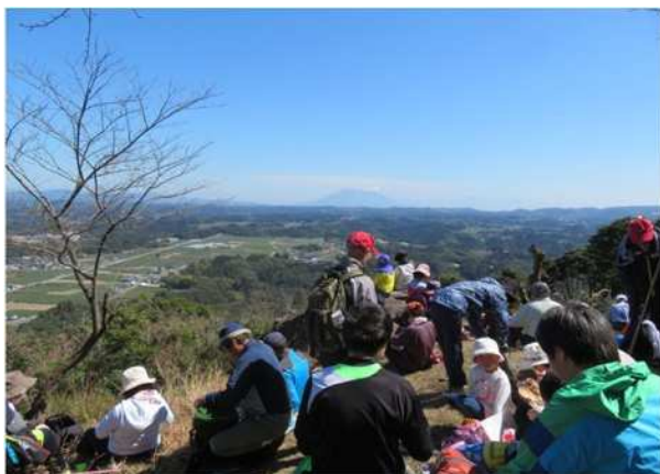
▲登山大会は平成30年度は約300名が参加。山頂では地元婦人部が作った筍の皮で包んだ特製弁当がふるまわれました。