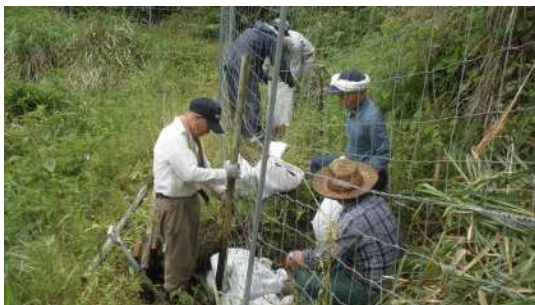
▲ 集落住民による侵入防止柵の管理作業