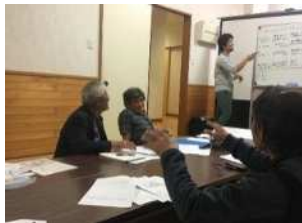
▲集落活性化に向けての話し合い