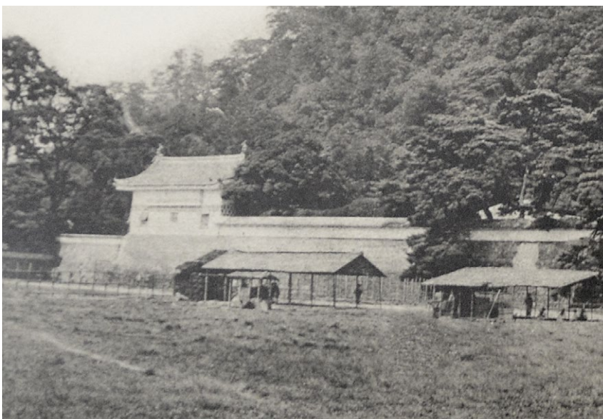
明治 5(1872) 年拍攝的城角箭樓