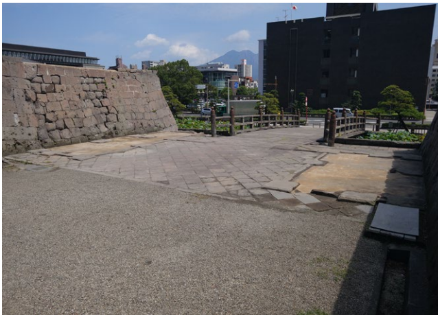
▲누문 축조 전 모습 (헤이세이 30(2018)년 9월 촬영)

또, 에도 시대 사쓰마번의 호레키 치수 공사의 업적을 인연으로 가고시마현과 자매현 맹약을 체결한 기후현으로부터 양 현의 우호 상징으로 기후현 산 느티나무를 증정받았습니다. 가고시마현 유스이초 등에 서도 목재 제공이 있었습니다.