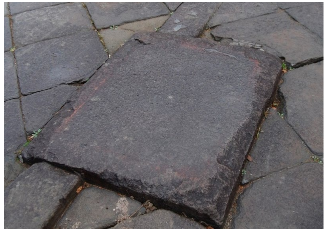
▲현존하는 누문 초석