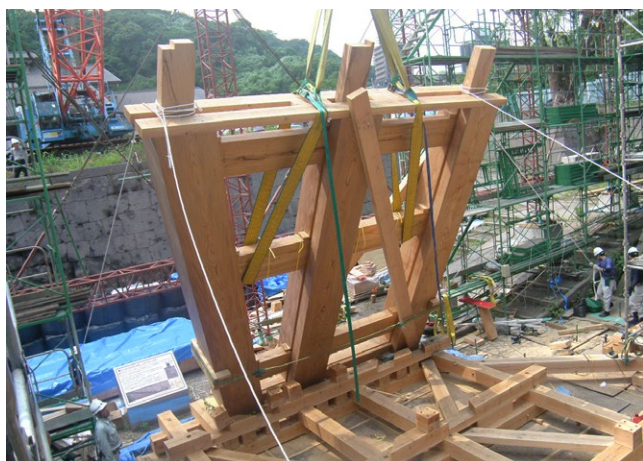
▲柱子的建造方式 (攝於令和元 <2019> 年 7 月)