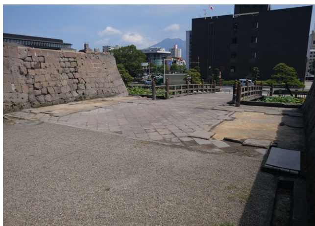
▲樓門建造前的身影 (攝於平成 30<2018> 年 9 月)

並且，緣於江戶時代的薩摩藩寶曆治水工程的功績，與鹿兒島縣締結姊妹縣盟約的岐阜縣，贈送了作為兩縣友好象征的岐阜縣產的櫟樹。且，鹿兒島縣湧水町等也有提供木材。