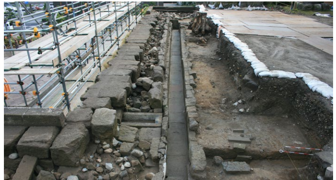
▲ 발굴된 배수구