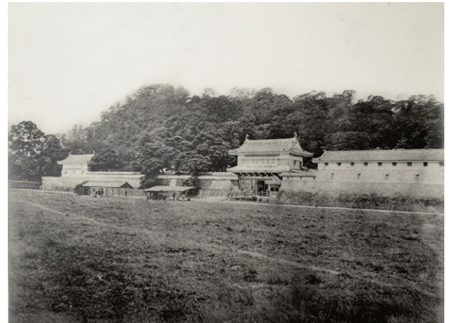
▲ 메이지 5 (1872) 년 가고시마 (쓰루마루) 성

성이 구축된 무렵 ( 게이초 6 년 : 1601 년 ), 이 성의 군사 기능의 핵심은 성산에 있었고 행정 기능의 핵심은 거처에 있었습니다. 또한, 번의 정치를 행하는 관청 중의 일부는 거처 이외에도 있었습니다.