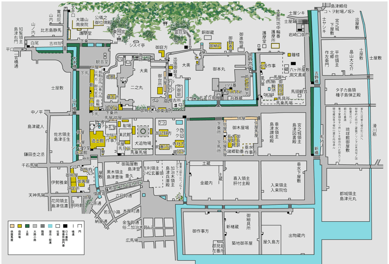
▲ 가고시마 (쓰루마루) 성 주변의 견취도 ( 「나루오 쓰네노리 성하평면도」 )

가고시마 (쓰루마루) 성의 혼마루는 폐번치현 후 메이지 5(1872) 년에 진제이 지방 군대의 분영이 되었고, 이듬해 메이지 6(1873) 년 12 월 화재로 소실되었습니다. 가고시마 (쓰루마루) 성의 변모와 대저택의 황폐함을 한탄한 전 사쓰마 번사 나루오 쓰네노리는 성 주변의 견취도 ( “나루오 쓰네노리 성하평면도” ) 와 혼마루 배치도 ( “나루오 쓰네노리 도면” ) 를 작성했습니다.