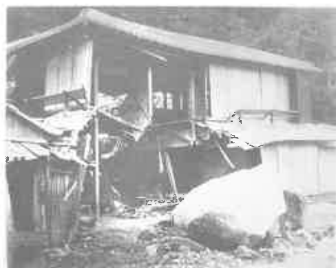
写真10 崩落した石で壊れた磯地区の民家