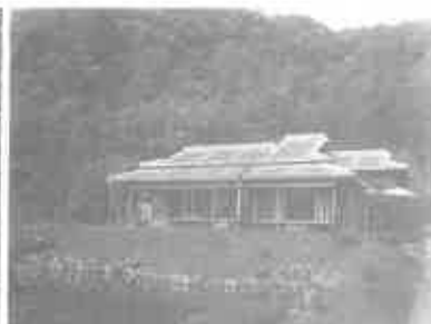
写真4 西向邸古写真