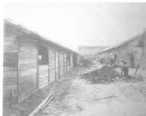
写真8 鹿児島水産学校跡の避難民収容所