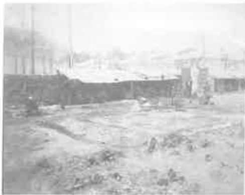
写真9 水産学校跡避難民収容所の炊事風景