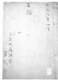
写真1 三年町島津家日誌

月一六日發である（なお原文では発信元と受信先でそれぞれ職員の名と氏名で改行をしているが、紙面の関係上改行を省略した。以下同じ）。