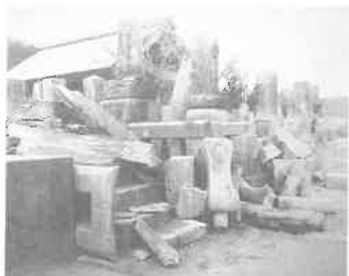
写真11 南州墓地で倒れた墓石群