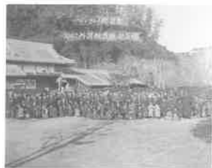
写真7 玉里邸の避難民