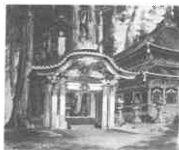
「日光水屋」1890（明治23）年頃

師：サン・ジョヴァンニ（イタリア、日本で最初の国立美術学校である工部美術学校画学科の三代目教授、1880（明治13）年来朝）