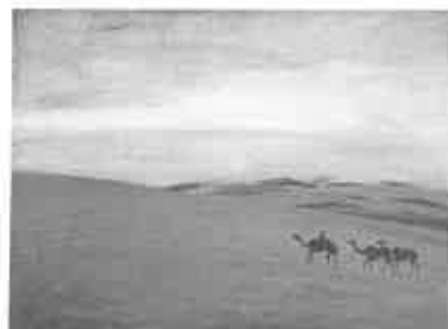
「蒙古の日の出」1937（昭和12）年

鹿児島藩士の子として生まれ，幼い頃から郷土の画家平山東岳について，四条派の絵を学び芳洲と号しました。1885（明治18）年に上京し，川端玉章に師事してさらに修行を積みました。この間，日本画家として展覧会でいくつかの賞を受けました。