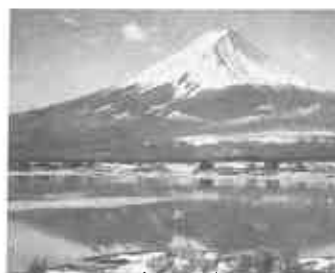
「富士（河口湖）」1926（昭和元）年

垂水市に生まれ，1879（明治12）年に，両親とともに上京しました。1887（明治20）年に明