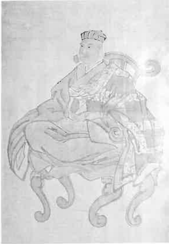
島津日新公肖像 『島津日新公』より転載

『島津日新公』に東岳筆の「日新公肖像」が掲載されている。僧衣の日新公が曲糸に座す像が描かれている。これには「日新公在世中佛師日高某に命じて自像を彫刻せしむ。今の武田神社の神體これなり。ここに掲ぐる肖像の原図は右の神體を摹寫せる畫中の逸品と称せらるるものを、明治四年頃鹿兒島の画伯平山東岳が、今の島津家編纂所員福島巖之介翁の囑によりて、更に摹寫せるものにて、多少のちがひは免れざらんも、