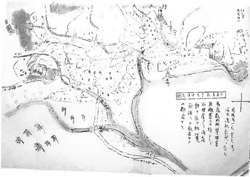
「大島首府金久伊津部全図」

(参考) 黎明館所蔵の「奄美史談」(写本) に掲載(添付)されている 絵・絵地図の一部