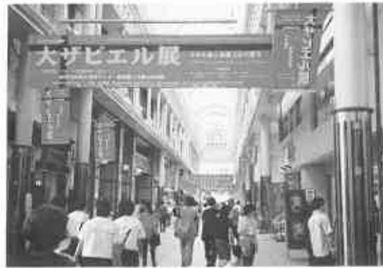
繁華街における広報

印刷が完成するまでには、配布先を整理し、宛先の住所シールを準備するなど配布作業が順調に進むようにしておく。この際、ポスターなど大型の印刷物を巻いて送るか、折って送るかも決めておき、このことを印刷業者に依頼する。巻いて送る場合には、折れないように紙筒を準備する。