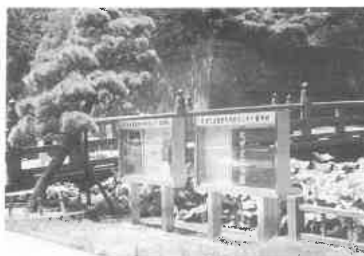
街頭におけるポスター掲示

印刷物の製作は、配布先・入館者の想定数などを検討して印刷部数を決め、写真を何枚使うか、紙質はどのようなものを使うか、納期はいつかなど印刷の仕様書を作成し、これによって入札を行う。入札までには、規則上最低必要な日数が