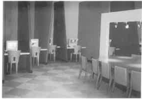
資料情報コーナー

博物館・美術館、新聞社、放送会社、その他が複数で実行委員会を組織し、各者が出資金を拠