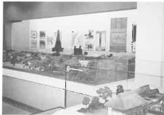
黎明館の常設展示場