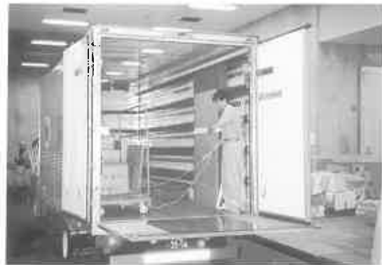
美術品専用輸送車

所蔵者とは、借用の日時を打ち合わせることはもちろんであるが、輸送方法についても事前に打ち合わせを行い、必要な梱包材料、機材などを準備しておけば作業が順調に進む。焼物の場合など、格納箱が有るか無いか、無ければ仮箱を段