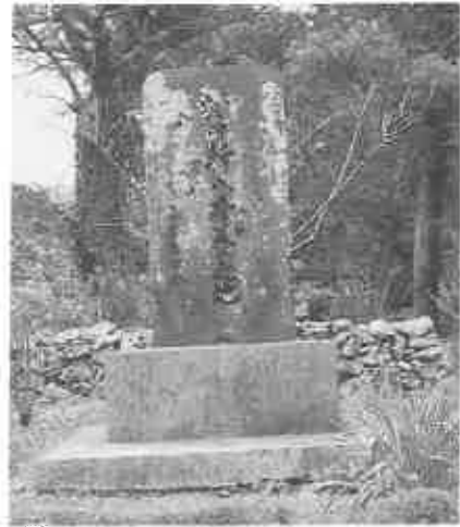
(村田新八修養の地碑)

家の亭主友憲が大の釣好きで、暇な時には昼夜とも磯に行くので彼に与えている。弓弦は、新八が弓の練習をした場所が今も残っており、後に鹿兒島に送り方を依頼した「ユスの棒、手、ころなもの」三本」を使って弓や剣術など武芸の鍛練をしたのであろう。