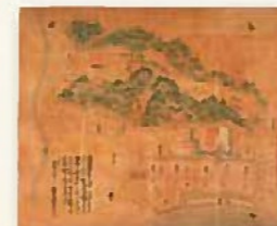
鹿児島城絵図控 (国宝 東京大学史料編纂所)