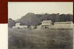
旧御本丸御楼門前之景 (黎明館)

鹿児島大学医学部移転後の黎明館・県立図書館建設や御楼門建設の際には発掘調査を行うとともに、石垣や御楼門の礎石部分などの文化財の保全に留意しました。礎石や古写真の解析によって考証された御楼門が、それ自体としては147年ぶり、鹿児島城が機能した時代の建物としては143年ぶりに再建され、令和2年春、完成しました。