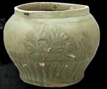
青磁酒壺 (一乗谷朝倉氏遺跡資料館)

この企画特別展「鹿児島の城館」では、古代・中世を振り返って鹿児島城に天守が無い別の理由を考えるとともに、江戸時代の鹿児島城の様子や、御楼門建設の様子を紹介します。