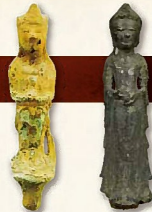
左：鞠智城跡出土銅像菩薩立像(複製)(熊本県立装飾古墳館分館 歴史公園鞠智城・温改刻生館保管) 右：吹上町田尻の金銅菩薩立像(黎明館寄託)