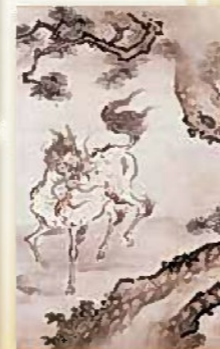
木村探元「松に鶴鷹の図」 (鹿児島市立美術館)