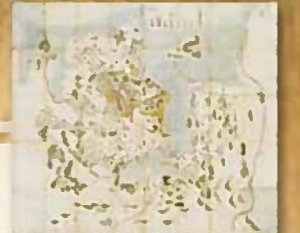
勝安芳日記 肥前唐津名護屋陣所絵図 (佐賀県立名護屋城博物館)