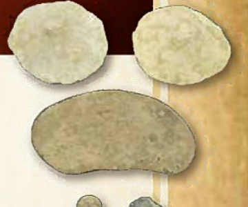
タイ産インゴット・鉛弾 (和歌山市)