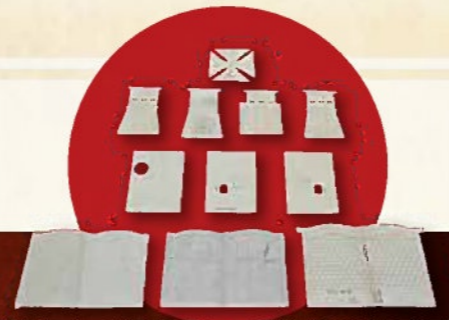
鳩小屋雛形 (鹿児島大学附属図書館)

残された歴史・考古資料からは、御楼門や登城に関する規則や、城中での生活の様子を垣間見ることができます。