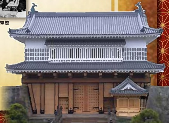
令和2年3月26日の 御楼門