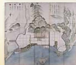
薩藩御城下絵図(鹿児島)