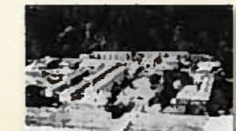
第七高等学校造士館空撮 (黎明館)