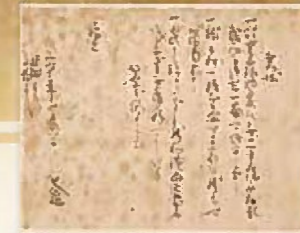
島津久逸起請文案 (国宝 東京大学史料編纂所)

一方で、鉄砲による戦術の変化を経た織豊政権の城郭は天守・高石垣を持つ近世城郭へと変化していきました。