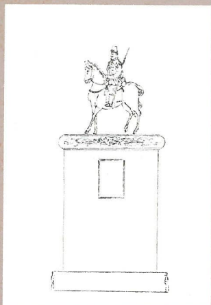
西郷像建設案と書類(京都・雲山歴史館)