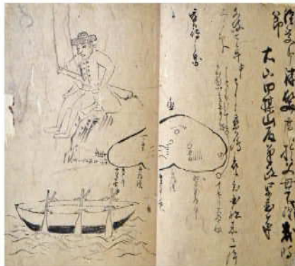
異国船宝島来泊一件