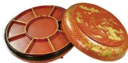
山水人物箱絵東道盆 [玉里島津家資料]