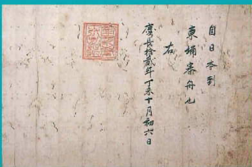
徳川家康異国渡海朱印状