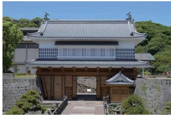
復元された御楼門

黎明館は、鶴丸城の別名で親しまれている鹿児島城の本丸跡に位置しています。鹿児島城跡は、近年の発掘調査や文献調査で新たな発見が相次ぎ、「天守のない屋形造りの簡素な城」というこれまでのイメージが大きく覆されることになりました。その成果が目され、令和5年3月には国史跡に指定されています。今回は、最新の調査成果から鹿児島城跡の「真の姿」に迫ります。