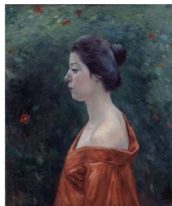
黒田清輝筆 赤き衣を着たる女/重要文化財 種子島広田遺跡出土品/イカエギ(岡田コレクション)[個人蔵]/重要文化財 色々威胴丸 兜・大袖付(肩萌黄)[鹿児島神宮蔵]

会期：令和6年2月2日(金)～2月25日(日) 会場：黎明館2階 第2特別展示室