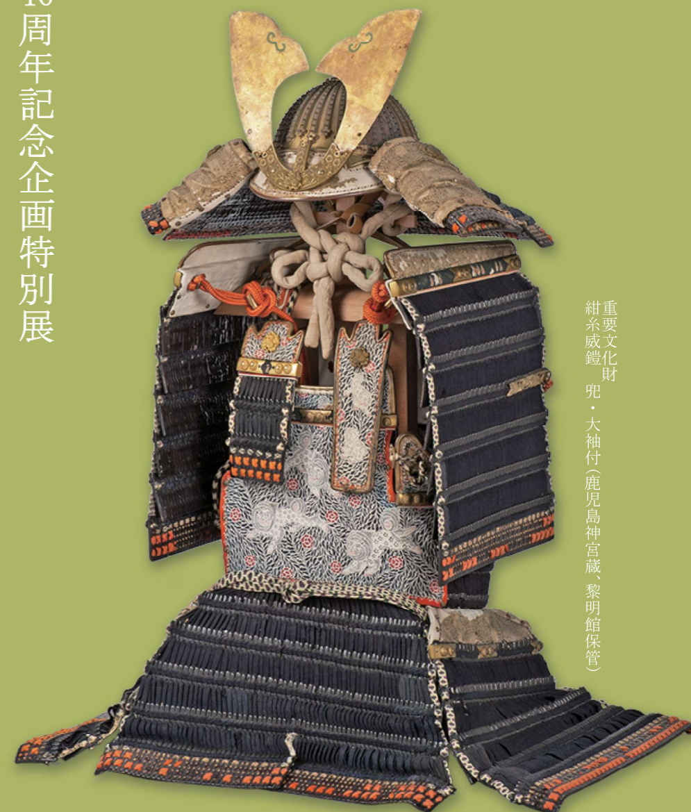
重要文化財 紺糸威鎧 兜・大袖付(鹿児島神宮蔵、黎明館保管)