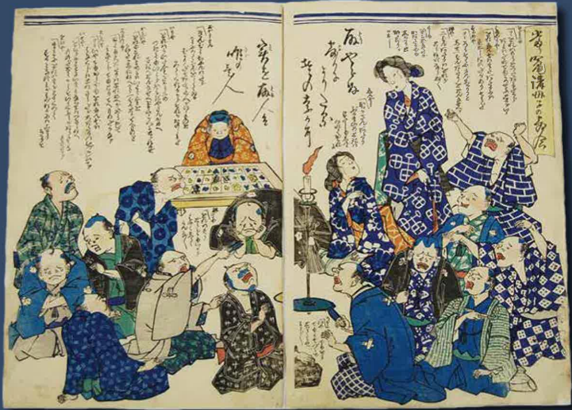
当り蘭講母子の寄合

2023年5月1日発行 編集・発行：鹿児島県歴史・美術センター黎明館 〒892-0853 鹿児島市城山町7番2号 ☎099-222-5100 FAX.099-222-5143 http://www.pref.kagoshima.jp/reimeikan/