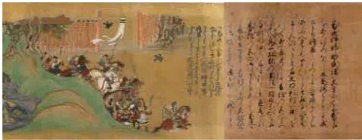
『太平記絵巻』巻第六 多々良浜合戦 (埼玉県立歴史と民俗の博物館蔵)

会期：令和5年9月29日(金)～11月5日(日) 会場：黎明館 2階 第2特別展示室