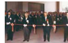
翌日 21 日には一般公開も開始され、初日から多くの来館者でにぎわいました。

10月20日、当時の文部大臣をはじめ約500人の来賓参列のもと、館の前庭で盛大に開館記念式典が挙行されました。