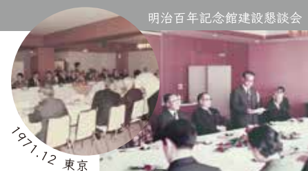
明治百年記念館建設懇談会

明治維新から100年を迎えるにあたり、郷土の歴史や文化遺産を後世へ伝えるために何かできないか、というところから、1966年10月に「明治百年記念事業委員会」が設立されました。これに端を発し、1969年4月に「明治百年記念館建設調査室」が設置され、記念館建設事業が本格的に動きはじめます。幾度にもおよぶ協議や委員会を経て、15年あまりの歳月をかけて黎明館の開館に至りました。