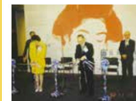
テープカットで華々しく開幕

第8回鹿児島・香港交流会議に合わせて、黎明館所蔵の美術作品を紹介する展覧会が香港で開催されました。橋口五葉や黒田清輝など、計55点の作品が展示され、香港市民を中心に多くの人に観覧されました。