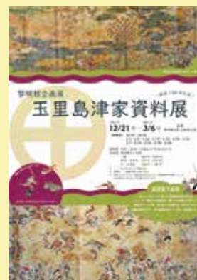
初展示「御屏風下絵写」