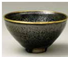
(重要文化財) 油滴天目 建窯 南宋時代 12～13世紀 九州国立博物館蔵

我が国を代表する文化である「茶の湯」をテーマとし、「薩摩の茶の湯」の侘茶との出会いや大名茶への展開など、歴史の動向や様々な文化交流によって育まれ拡がりを見せる姿を、美術・工芸や考古、歴史資料等を通じて、掘り下げて紹介します。