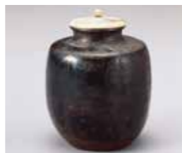
(鹿児島県指定有形文化財) 漢作肩衝茶入 銘 平野 島津家重物 尚古集成館蔵