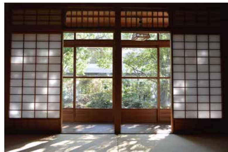
十畳の広間には炉が切っており、大人数での茶会に最適です。