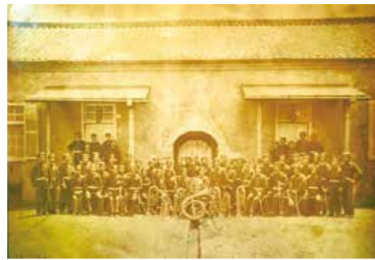
海軍軍隊隊古写真 明治14(1881)年撮影 同隊の全体写真としては最古。

黎明館は約18万点もの資料を収蔵していますが、なかには貴重な内容を含みながら展示機会に恵まれない資料も少なくありません。本展は、幕末・明治期の未公開資料を中心に、これまであまり知られてこなかった人物や出来事に光をあてる展覧会です。例えば、日本吹奏楽の黎明期に活躍した薩摩藩士の数奇な人生、新政府の参与に任命されながら蝦夷地の海で消息を絶った悲劇の人など、様々なエピソードを準備しています。