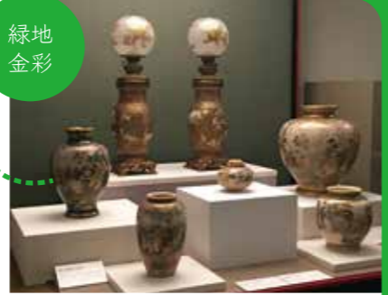
錦手花鳥婦人図花瓶 七代錦光山宗兵衛 京薩摩 19世紀後半

薩摩焼に無縁の「SATSUMA」人気は些か穏やかではありませんが、作品は魅力に溢れています。その華麗な作例を3Fロビーに展示中です。ぜひご覧ください。