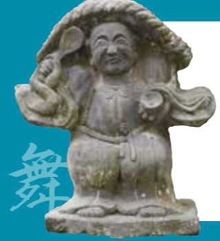
あいら ひらまつふれた 始良市平松触田の田の神像(模刻) 像高89cm

この田の神像は、神職型で、頭に笠状のシキをかぶり、右手にメシゲを持っています。民家「樋の間二ツ家」の裏手にある、桐の木の下に展示しています。