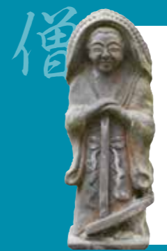
かのや あいら かみみょうなかふくら 鹿屋市吾平町上名中福良の田の神像(模刻) 像高96cm

この田の神像は、僧の姿をしています。僧型は、仏像型から発展した型式で、薩摩半島の中央部と大隅半島の中央部に多く分布しています。シキと呼ばれる甑の底に敷くワラの敷簀(しきす)を頭にかぶり、手にはオデグワ(風呂鉞)を持っています。また、背中にはメシゲ(しゃもじ)をさしたワラツト(種籾を入れる藁袋)を背負っています。