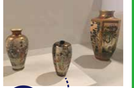
瑠璃地金彩 錦手婦人図花瓶 京薩摩 19世紀後半