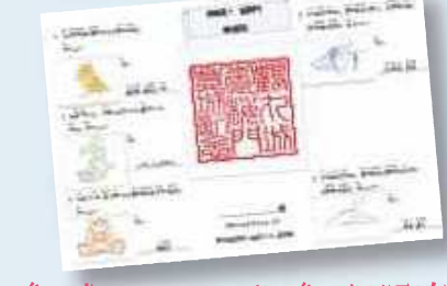
参加者には、シールつきの参加証を配布!