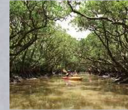
上/カヌーの操作は初心者でもすぐに覚えられます。下/マングローブの生命力に満ち溢れたトンネルを進んでいこう

奄美大島のほぼ中央に位置し、国内有数のマングローブ林が広がる住用町。自然に気軽に触れ合える「黒潮の森マングローブパーク」は、カヌーで行くマングローブ体験が大好評。カヌーの操作を簡単な講習でマスターしたら、川を進み、マングローブのトンネルへ。大人でも思わず歓声を上げる光景が待っている。