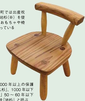
屋久島町では出産祝い品に地杉(※)を使用したおもちゃや椅子を贈っている