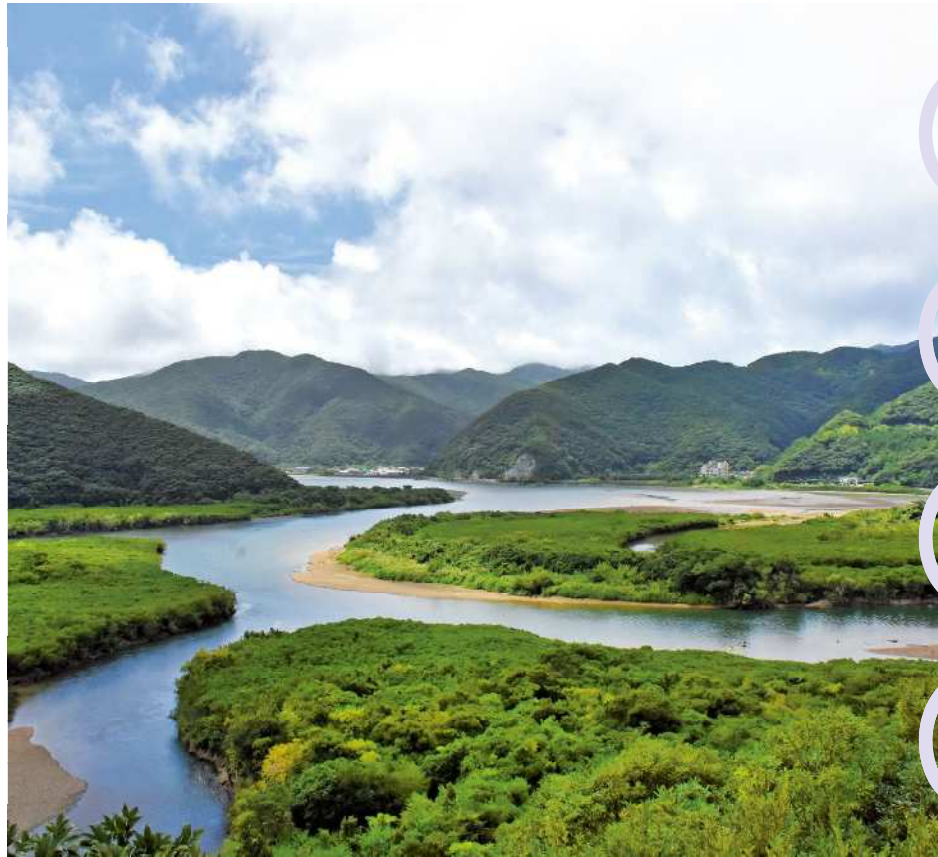
海水と淡水が入り混じる汽水域に広がるマングローブ林。無数の稚魚や水生動物、鳥類を育むことから「生命のゆりかご」と呼ばれる