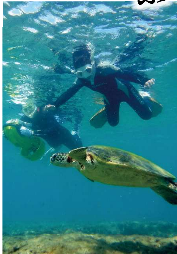
透明度の高い屋久島の海。運が良ければウミガメに出会えるかも

屋久島マリンスーパース YMS 熊毛郡屋久島町小瀬田 913-53 TEL 0997-49-4380