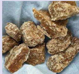
黒糖そのものの他、ピーナッツに黒糖を絡めたもの、黒糖かりんとうなどの菓子が人気。米麹と黒糖から造られる「奄美黒糖焼酎」も注目されている

黒糖 製糖始まりの地で味わう深いコクと濃厚な甘み 一六〇〇年代初頭、奄美大島出身の直川智が琉球に渡航中に台風に遭い、中国福建に漂着する。その際、サトウキビ栽培と製糖技術を修得し、苗を三本持ち帰り栽培。一六一〇年に黒糖を製造したのが日本における製糖の始まりと言われている。奄美の黒糖は、カラメルのような苦みと深いコクのある甘みが特長。サトウキビの搾り汁をそのまま煮詰めて、冷やし固めて作られるため、ビタミンやミネラルを豊富に含んでおり、健康食としても注目されている。