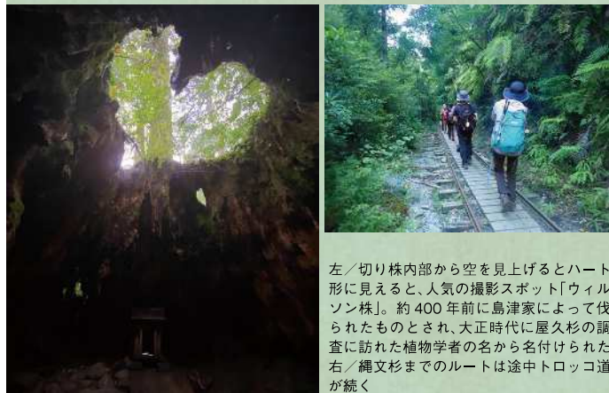
左/切り株内部から空を見上げるとハート形に見える、人気の撮影スポット「ウィルソン株」。約 400 年前に島津家によって伐られたものとされ、大正時代に屋久杉の調査に訪れた植物学者の名から名付けられた。右/縄文杉までのルートは途中トロッコ道が続く