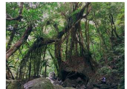
住用河内川の支流の巨大ガジュマル