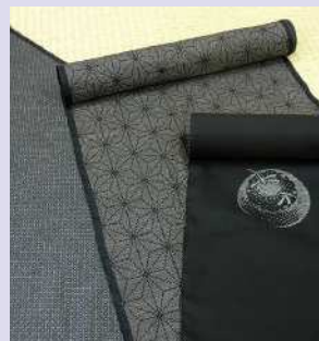
本場奄美大島紬の製造工程を見学できたり、泥染めやはた織り、着付けなどが体験できたりする観光施設もあるので、訪れる前に確認したい

本場奄美大島紬 日本の最高峰の絹織物受け継がれる伝統技術 絹織物ならではの光沢と、緻密な染めと織の技術で生まれる美しい柄、さらっとした手触りが魅力の本場奄美大島紬。軽くて暖かく、着れば着るほど体に馴染み、着崩れしにくく、しわになりにくいという特徴がある。現在、本場奄美大島紬協同組合が運営する「本場奄美大島紬技術専門学院」では、紬職人の後継者の養成を行っている。また、若い職人たちが立ちあげた「本場奄美大島紬NEXTプロジェクト」などの取り組みもすすめられ、後世への伝統技術の継承が行われている。