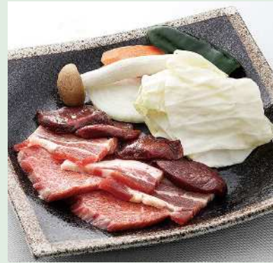
栄養価が高く健康食としても人気。島内では焼き肉店やレストランで提供されている

近年では、捕獲数が減少し、貴重になっていくヤクシカジビエ。「ヤクシカブランド」として県内外から注目を集めている。