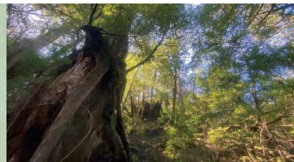
地面だけでなく、岩や張り出した木の根までが苔に覆われた世界が広がる白谷雲水峡。往復1時間、3時間程度のルートも用意されている