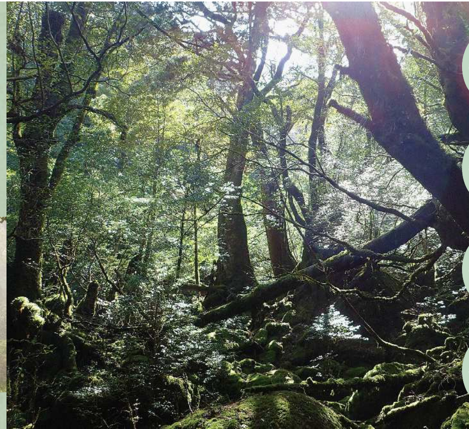
どこかで精霊が見守っているような、神秘的な空気を湛えた屋久島の森