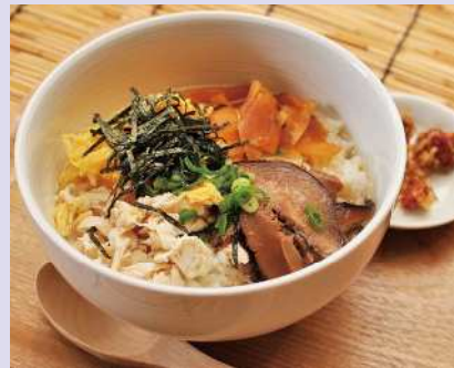
具材やスープの取り方などに各店のこだわりがある。お土産用にパウチされた製品やフリーズドライの製品も販売されている

鶏飯 江戸時代に生まれた郷土料理 江戸時代に、鹿児島本土からやってくる薩摩藩の役人をもてなすための接待料理としてつくられたのが始まり。当時は鶏の炊き込みご飯のようだったが、昭和に入り、スープをかけて食べる形が一般的になる。現在は、茹でてほぐした鶏肉、干し椎茸、錦糸卵、パイアの漬物、タンカンなどの柑橘類の皮を、白米にのせ、鶏のスープをかけて食べる。奄美大島の鶏飯では、鶏飯作りを体験できる店もある。