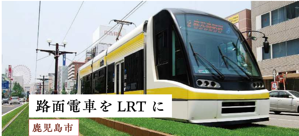
緑化された軌道走る低床車両

割合で低床車両を運行し、バリアフリー化を進めている。一方、既存の車両も修理しながら大切に走らせており、これもまたエコにつながる取り組みと言えます。この他、軌道敷緑化の整備や、低振動・低騒音のための軌道改良工事なども進めている。