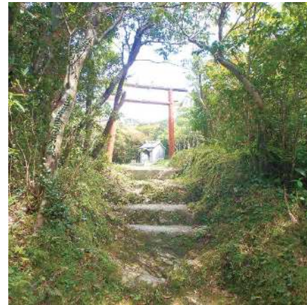
頂上には島の開祖と謳われる二神を祀った奄美大師御堂が建つ

本場奄美大島紬 日本の最高峰の絹織物受け継がれる伝統技術 絹織物ならではの光沢と、緻密な染めと織の技術で生まれる美しい柄、さらっとした手触りが魅力の本場奄美大島紬。軽くて暖かく、着れば着るほど体に馴染み、着崩れしにくく、しわになりにくいという特徴がある。現在、本場奄美大島紬協同組合が運営する「本場奄美大島紬技術専門学院」では、紬職人の後継者の養成を行っている。また、若い職人たちが立ちあげた「本場奄美大島紬NEXTプロジェクト」などの取り組みもすすめられ、後世への伝統技術の継承が行われている。