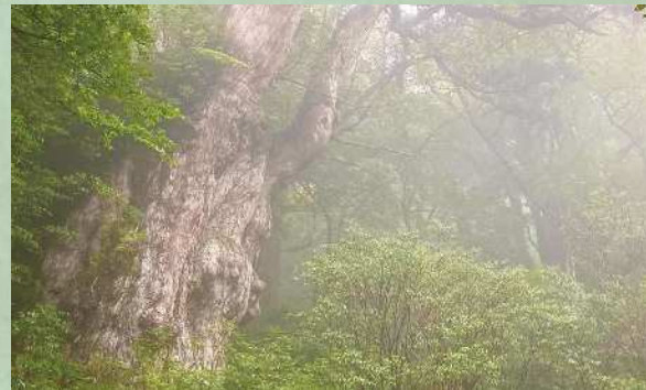
樹高 25m 以上、太さ 16m 以上を誇る最大級の屋久杉「縄文杉」。その荒々しい木肌は、樹齢 7200 年とも言われる長き生涯を物語るかのよう。屋久島では樹齢 1000 年以上が「屋久杉」、それ未満は「小杉」と呼ばれる

白谷雲水峡(P11)と並び、人気を二分する縄文杉。その圧倒的な存在感は、屋久島の神秘の森を象徴する光景と言えるだろう。「縄文杉までの道のりは往復で10時間以上かかることも多い本格的な登山になりますが、途中、頭上がハート型に開けたウィルソン株や、三代杉、大王杉といった巨木を見ることがもできるので、天候の急変などで途中で引き返すことになった場合でも、屋久島らしい景色に出会うことができますよ」と大野さん。