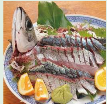
鮮度が命のため、この食感を味わえるのは水揚げされて24時間程度。地元では、刺身のほかにすき焼きとしても楽しまれている