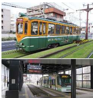
上/昔ながらの車両も活躍。写真は600形1962年製造 下/2021年、鹿児島県周辺都市拠点総合整備事業に連動して鹿児島駅前停留場を整備し、アクセスや待合環境を改善