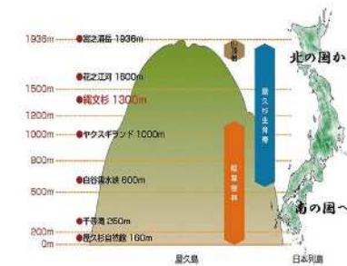
標高約 2000m の高山が連なる屋久島は、日本国内すべての地域の気候を経験できると言われている

た植物が帯をなすように変化していく「植生の垂直分布」が見られることなど、国内でも唯一の自然環境が評価されたから。世界遺産の登録地域は島内の約二割に及び、そこには観光客が足を踏み入れることのない太古の自然が息づいている。