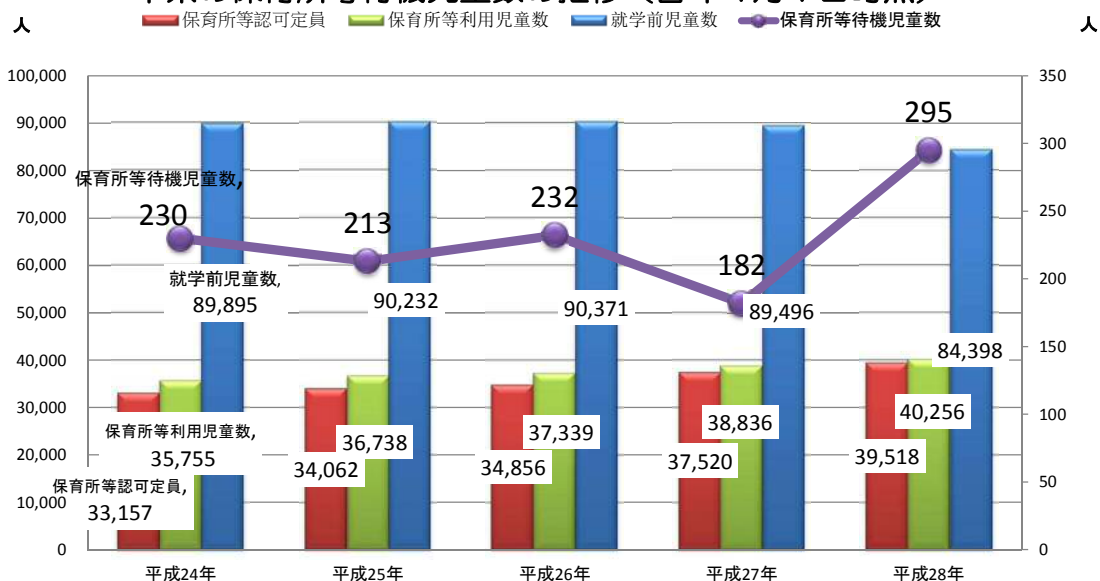
本県の保育所等待機児童数の推移(各年4月1日時点)

(注1) 平成27年以降の認可定員及び利用児童数は、保育所及び幼保連携型認定こども園(2号・3号認定)の数値 (注2) 就学前児童数は、前年10月1日現在の鹿児島県年齢別人口推計結果