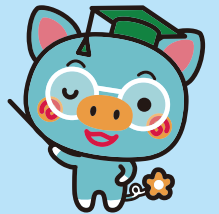
まなぶー