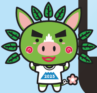
燃ゆる感動かごしま国体マスコット ぐりぶーファミリー「ぐりぶー」