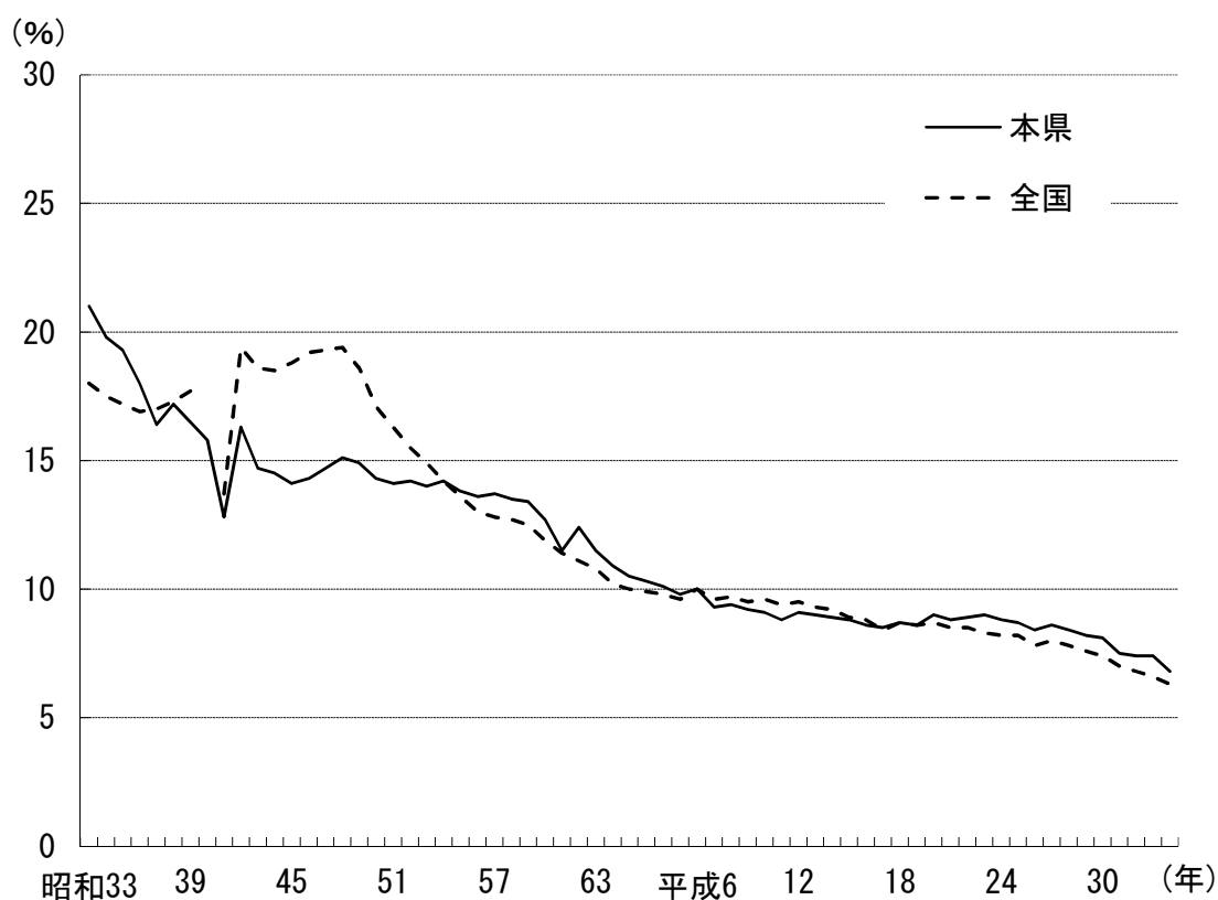
【出生率（人口千対）・合計特殊出生率の年次推移】