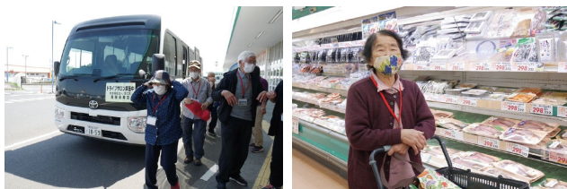
ドライブサロンの様子

地区内の社会福祉法人や社会福祉協議会と連携し、週に1度地区外の商業施設へ送迎を行う「ドライブサロン」事業を行っている。交通手段の無い高齢者等の買い物支援と併せて健康状況の確認や安否確認、生きがいづくりを目的とした生活支援サービスで、地域全体で高齢者を支える仕組みづくりを行っている。