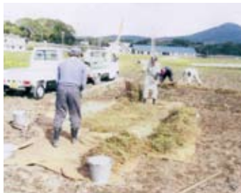
自家栽培そばの収穫

仕事中心で生活してきた男性は、地域の中でネットワークを築けない方がおり、現役を退くと自宅以外の居場所が少ないです。また、公的サービスは女性が利用主体となっているため、男性はその中に入れず孤立する場面も見られます。誰もが人とつながりながら暮らせるような居場所づくりに自治会と協働で取り組んでいます。