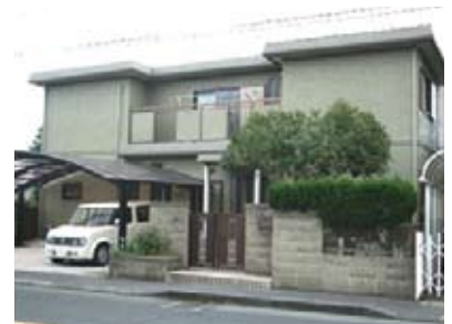
自立援助ホーム「ばらそる」