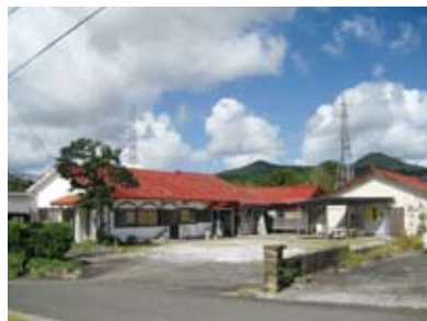
支援施設(合宿型含む)静活館(せいかつかん)

《合宿型施設》児童相談所の委託により20歳未満を対象に社会的自立に向け、学業および就労を支援しています。