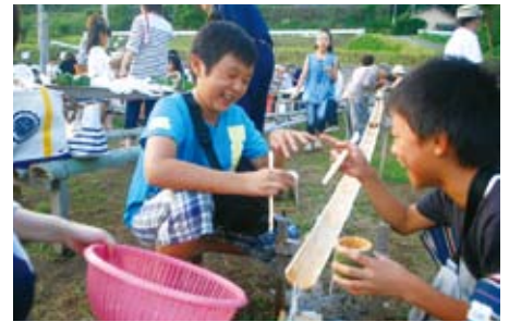
七夕祭り(ソーメン流し~H24.7.7開催)

親子を対象に地域住民の知恵や農業などを活用した体験プログラムを用い、親子で共感出来る場を提供しながら、家族関係の良化を図り、子育て支援事業の定着化と活性化につなげていく「地域と連携した子育て支援事業」を実施しています。