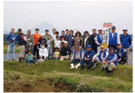
芋植え(南九州市穎娃町~H19.4.16実施)。 まちおこし焼酎「穎娃」用の唐芋苗植え。自分たちの芋だ けで造る焼酎はここから始まりました。(南九州市西山農 園にて)

生産人口の減少に危機を感じ、「総力戦 で生き残れ」をテーマに様々な角度より 地域の活性化に取り組んでいます。