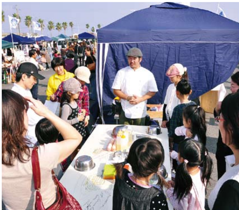
自作マヨネーズで地元の食べ物を試食