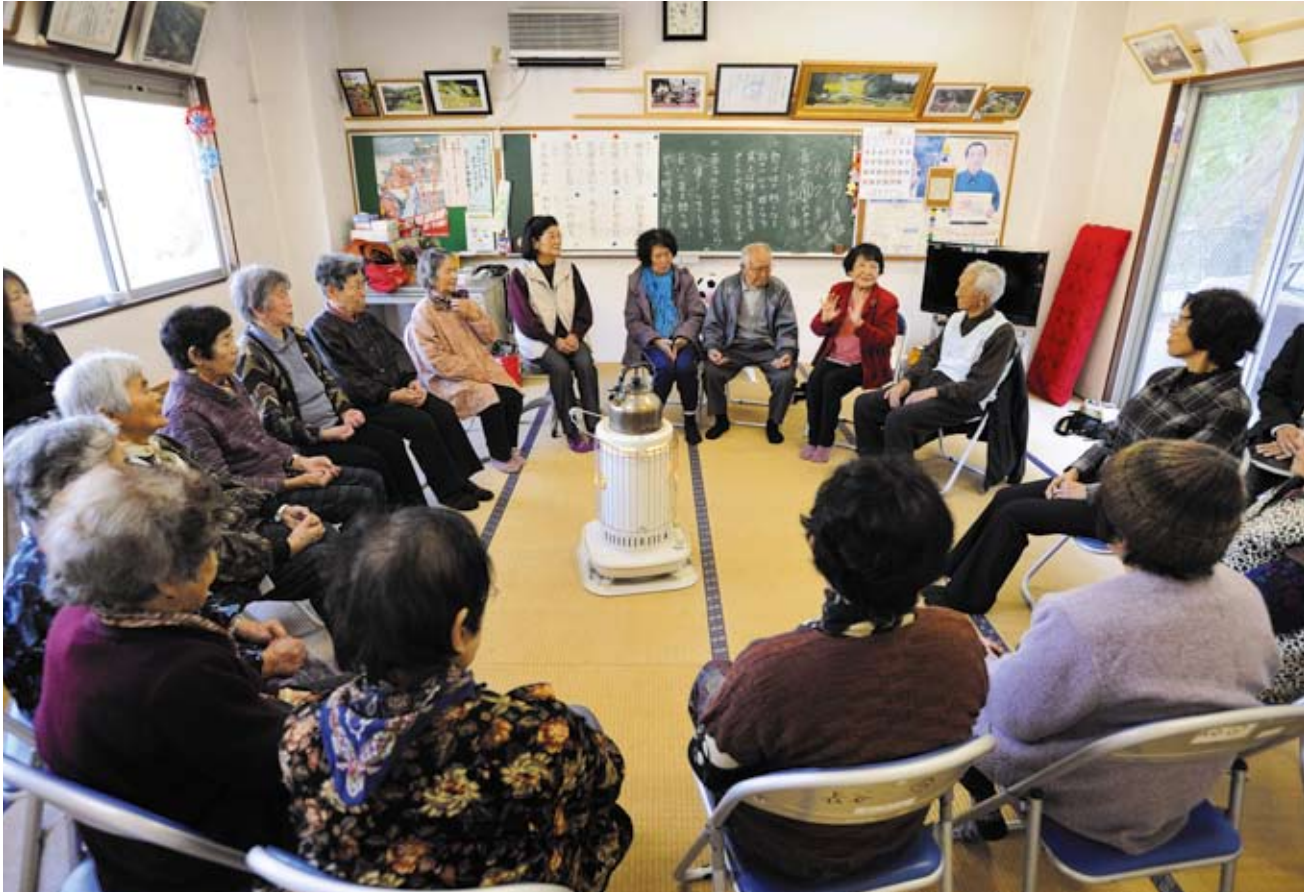
毎週1回行われる長谷おしゃべりクラブ。最近、集落外からの参加者も増えました。(南さつま市金峰町大坂長谷コミュニティ消防センター)