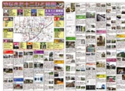
やなきた十二ひと絵図

自分達の地域を知ることから互いのつながりを強め、くらしの安心・安全や協働のまちづくりを進めていく。そういったことを目指しながら、地域の見える化活動として、様々な地図づくり(やなきた十二ひと絵図)に取り組んでいます。