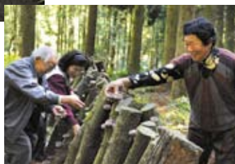
長谷集落でのシイタケ栽培▶ 米作りと同じく、協力しあってシイタケも栽培しています。できたシイタケは、大坂ふれあい館でも販売しています。