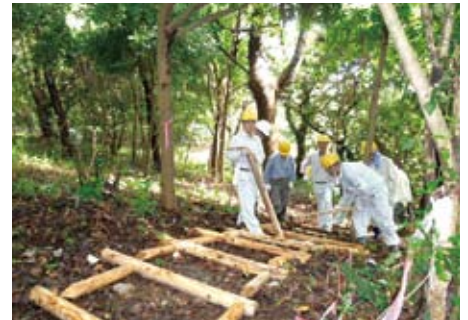
魚見岳(指宿市)での森林ボランティア

荒廃した自然や社会環境の再生と保全のためのまちづくりの推進と、植樹を中心とする環境保全に関する事業を行い、もって社会全体の利益の増進に寄与することを目的としている団体です。