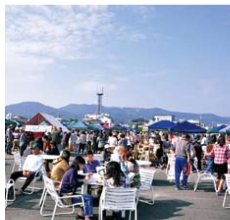
毎回多くのご来場をいただいています。

指宿の豊富な食材や人材、すべてを総合的にアピールできる場所を作ってみたい…との思いから、地元の若手経営者で実行委員会を結成。「いぶすきマルシェ」を開催しています。