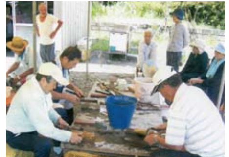
男談事業(刃物研ぎ支援)

公的な制度だけでは、地域の支え合いは困難になっています。社会保障のすき間を埋める活動を行いながら、新たな支え合いの形を模索しています。1つの団体の活動には限界があります。これからは、他団体との協働活動が重要になると考えて活動しています。