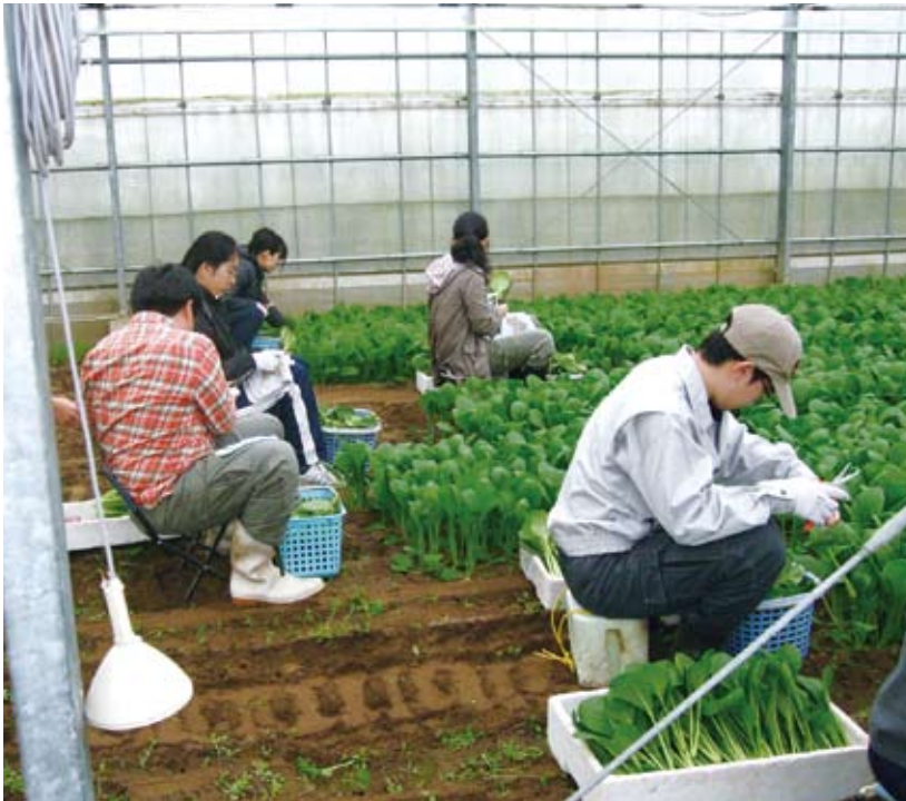
《就労準備体験》グループでの小松菜収穫