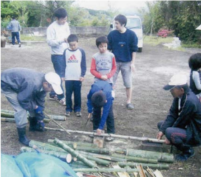
男談事業(子ども会との交流)