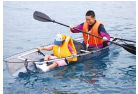
サンゴ保全事業。透明カヤックからサンゴ礁を鑑賞している様子(H24年10月実施のサンゴツアー(南さつま市坊津町秋目沖))

グリーン・ツーリズムによるまちづくり活動、環境保全活動などの取り組みを通じた環境共生型社会の実現に取り組んでいます。