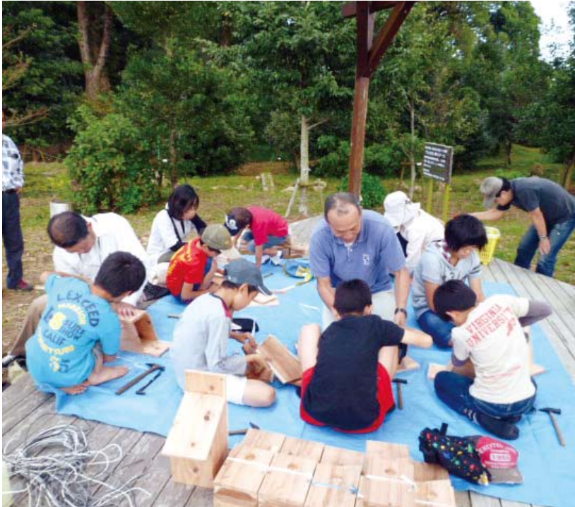
「てんちの杜」(指宿市)での巣箱作り