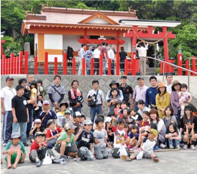
番所・釜蓋シーサイドウォーキング(南九州市穎娃町~H24.6.23実施)釜蓋神社到着後の集合写真。 同ウォーキングは、番所鼻自然公園から釜蓋神社間の2kmの海岸線をガイドと歩くイベントで毎年開催 していますが、今回は第1回ばんどころ絶景祭りの一環で実施しました。