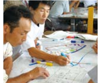
絆プロジェクト。要援護者支援や防災のためのマップ作りに取り組んでいます。