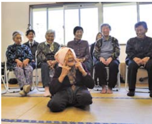
長谷おしゃべりクラブ。レクリエーションやスポーツ、おしゃべりをして皆で楽しく過ごします。

南さつま市で地域住民や行政と協力し、文化事業、自然とのふれあい等を通じた社会貢献活動としてのまちづくりを行っています。