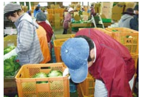
協力事業所JA選果場での就労体験

様々な原因で学業や就労について困難を抱える青少年に対し、社会的自立を援助する活動を目的とする団体です。