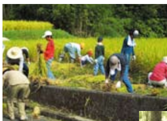
◀長谷集落での米作り体験 (集落活性化事業) 都市部の住民や大学生と協力して米作り体験を行っています。地元住民の皆さんに、指導や管理をお願いしています。