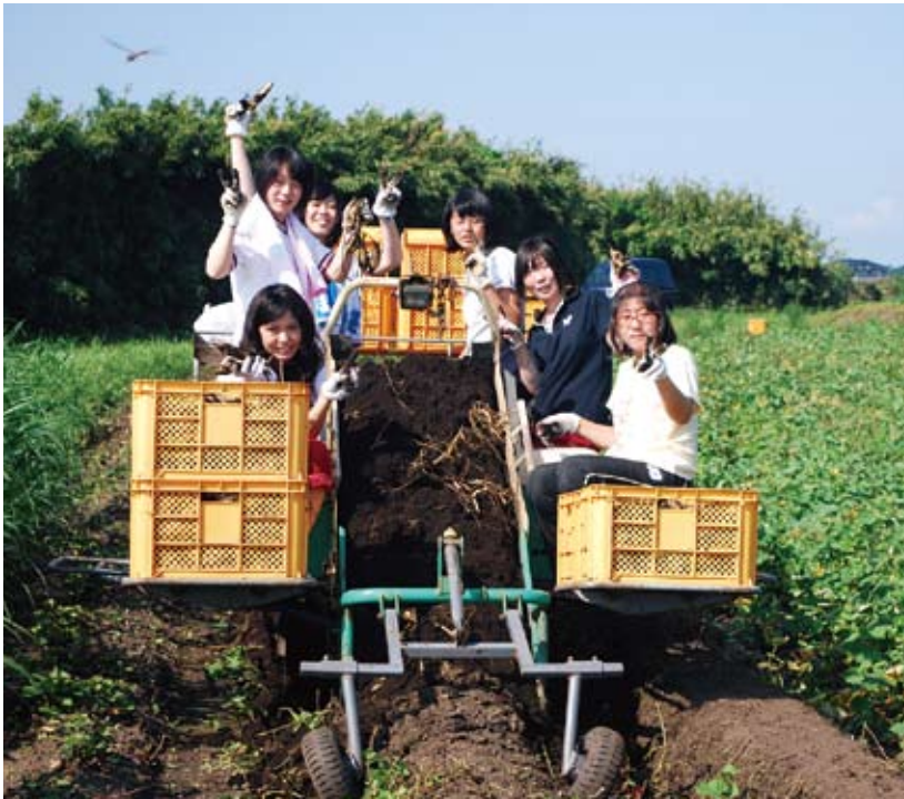
民泊型教育旅行事業。関東からの修学旅行生にサツマイモの収穫作業を体験してもらっている様子です。(H20年10月実施の修学旅行生民泊受入(日置市吹上町))