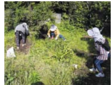
一人暮らし宅の庭の草取り支援

ボランティア講座を毎年開催し、福祉の理解を広げる活動を行っています。併せて、ボランティア登録した方を「地域の応援団」として施設や自宅に派遣し、人がつながる生活が送られるよう支援しています。平成24年度からは、この活動が南九州市全体に広がるように、地域の社会福祉協議会と協働で取り組んでいます。