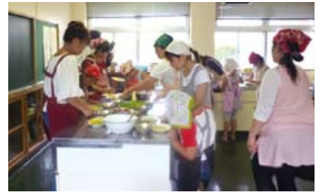
「絵本deおやつ作り」(柳田校区公民館) 「ルルとララのわくわくクレープ」という本に出てくるクレープを親子で作っています。クレープの粉には、地産地消の意味合いを込め、指宿市の特産品オクラを使った「おくらパウダー」を混ぜた粉を作りました。