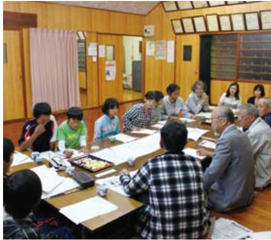
各地区探検隊作戦会議。 地域のことを自分達で感じ、発見していくための作戦会議。