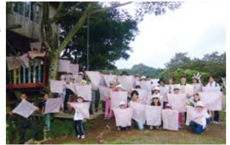
草木染め体験(親子体験ふれあい事業)