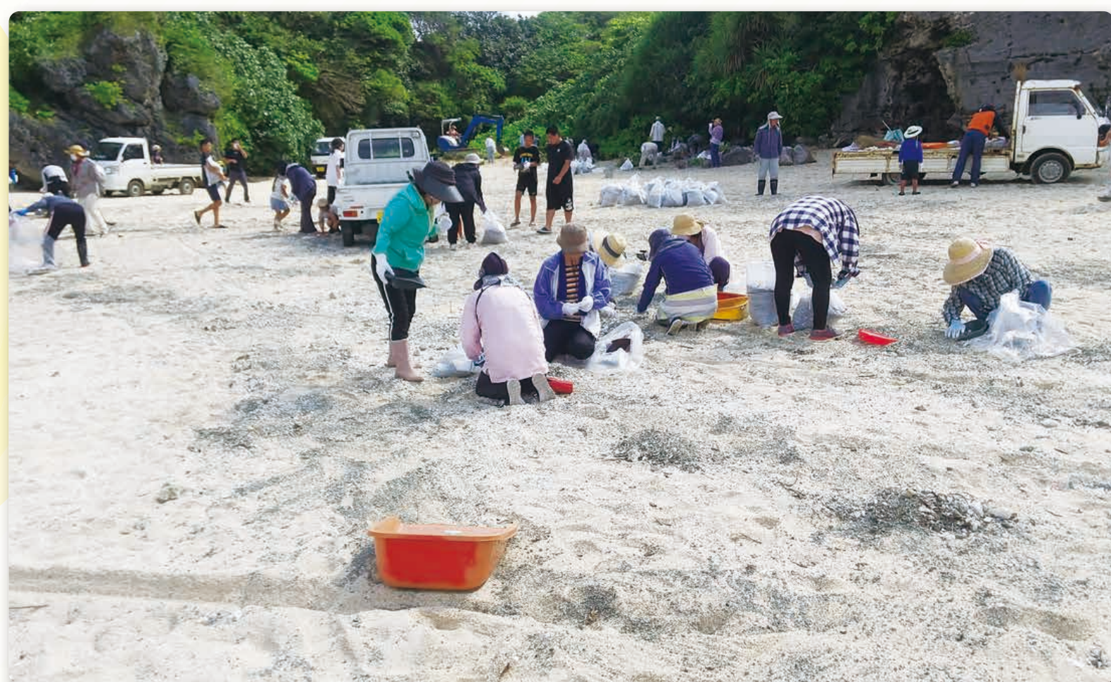
シニキチャ海岸の美化活動

正名字子ども会育成会、正名字青年団、正名字壮年団、正名字地女連、正名字老人クラブ、正名字、知名町立住吉小学校 など