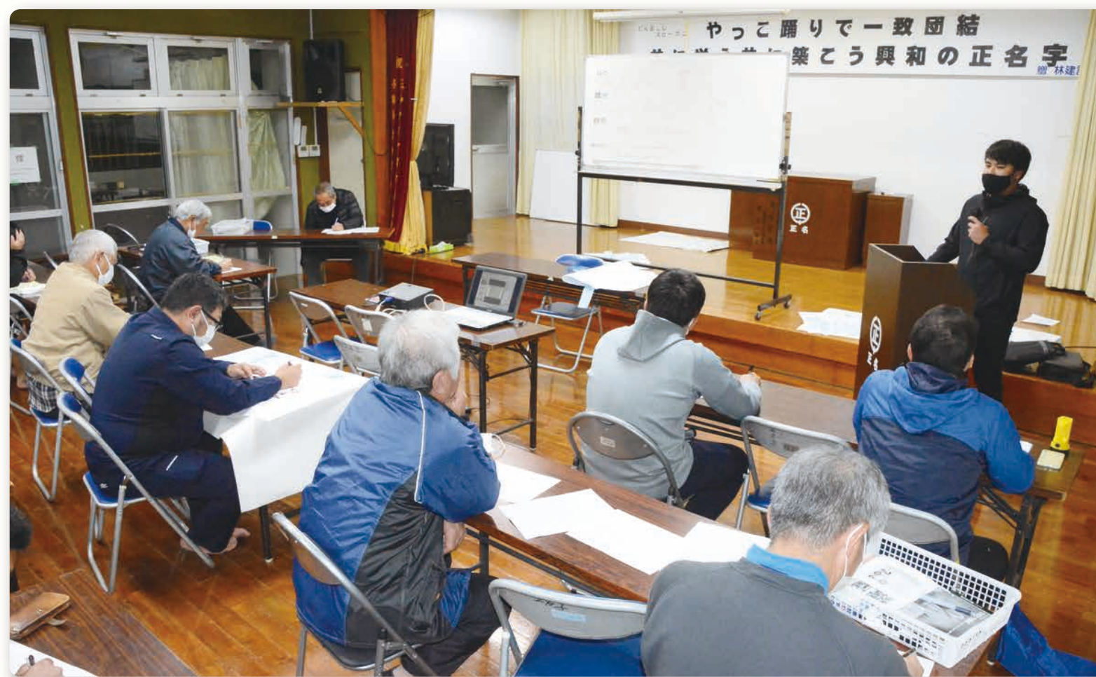
正名字(しま)づくり実行委員会