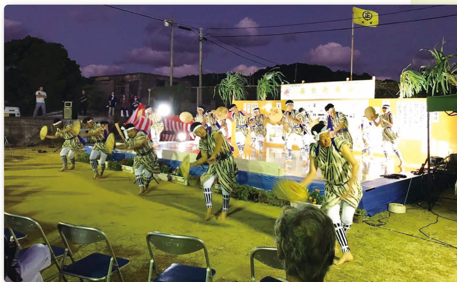
県指定無形民俗文化財 正名字ヤッコ踊り