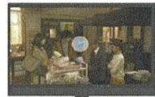
コネクテッドTV Coming soon....