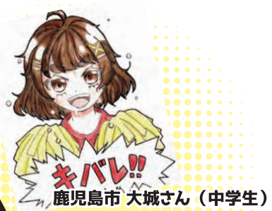
鹿児島市 大城さん (中学生)

■小学生(1~6年生) ■中学生(1~3年生) 学校単位、クラス単位、個人でも受付OK!! 各学年のハガキ作品募集!