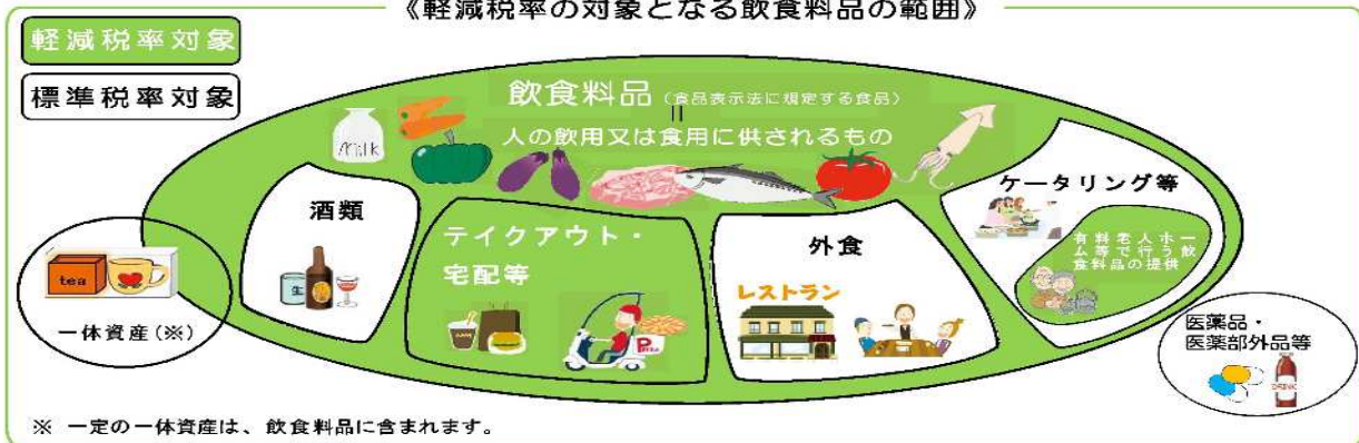
《軽減税率の対象となる飲食料品の範囲》